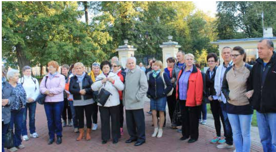
Spacer po zespole pałacowo-parkowym podczas pięknej pogody to czysta przyjemność.

Ostatnim punktem wycieczki był Nałęczów gdzie spacerowaliśmy po jego zdrojowej części. /kg/