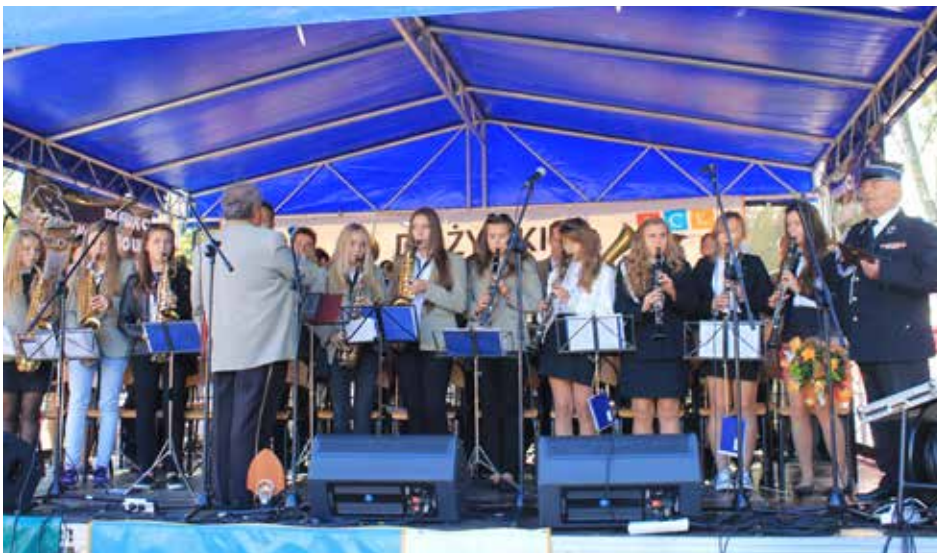
Orkiestra Dęta bierze udział nie tylko w uroczystościach gminnych, ale też działa ponadlokalnie.

W chwili obecnej Zespół liczy blisko czterdzieści osób, głównie są to osoby młode. Repertuar Orkiestry jest różnorodny, od muzyki kościelnej, poprzez marszową, a na klasycznej skończywszy. /kg/