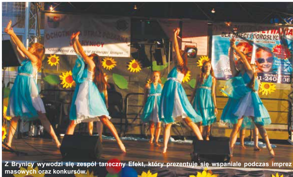
Z Brynicy wywodzi się zespół taneczny Efekt, który prezentuje się wspaniale podczas imprez masowych oraz konkursów.