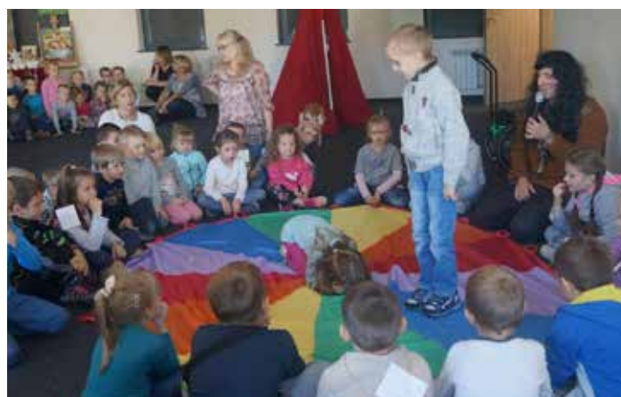
W trakcie zabawy z Indianami dzieci miały do wykonania wiele zadań, które wymagały sprytu i skupienia.