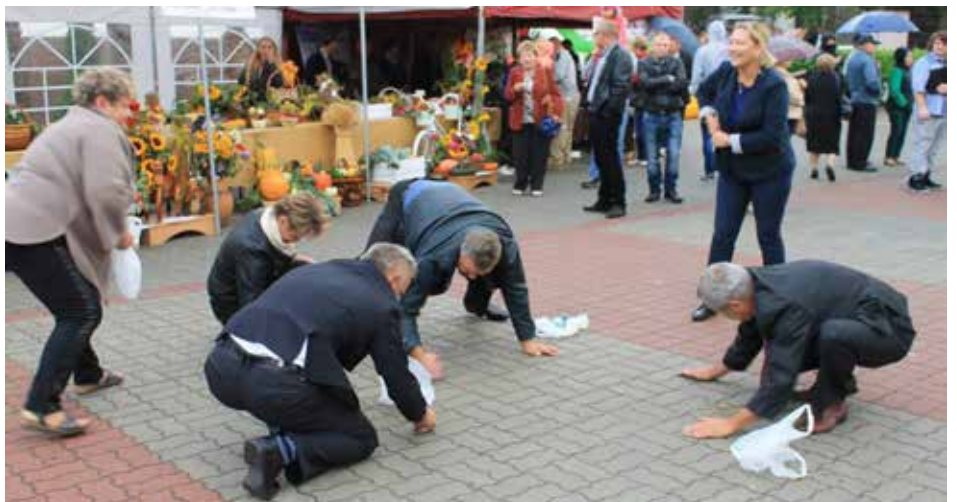
Sołtysi zmagali się ze „zbieraniem podatków”. Nie było to takie łatwe.

nych pięknych jubileuszy oraz dalszego, równie owocnego, propagowania kultury. Więcej na temat Orkiestry Dętej w artyku-