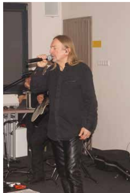
Na zakończenie Dnia Otwartego odbył się koncert akustyczny