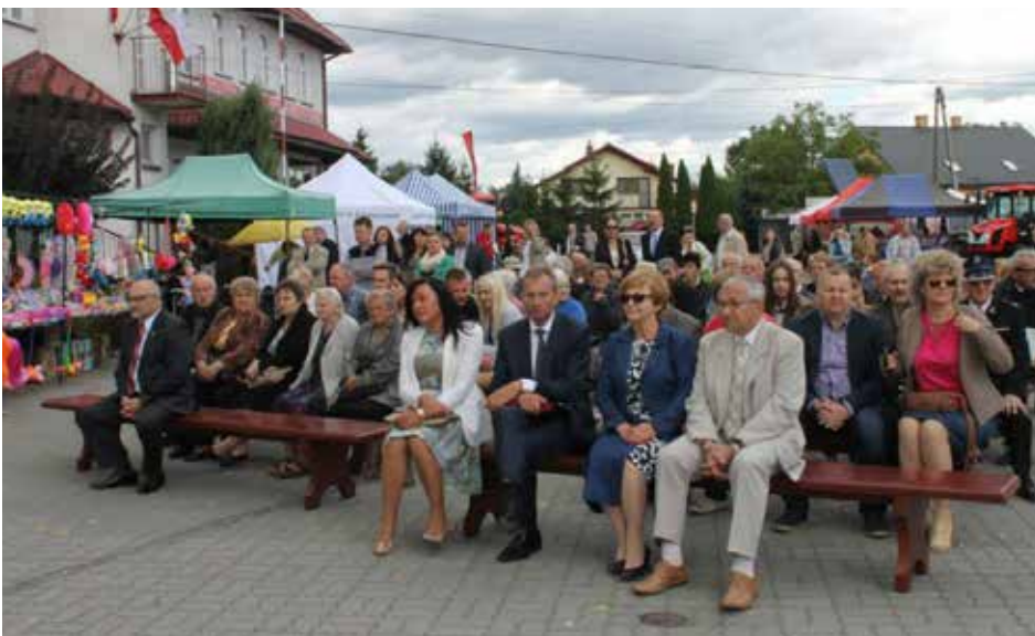
Mimo niezbyt sprzyjającej pogody na Plac Niepodległości przybyło wielu mieszkańców i gości.

O wspólne zjednoczenie się społeczeństwa i wytrwałe dążenie do celu dla dobra małej ojczyzny, prosiła rów-