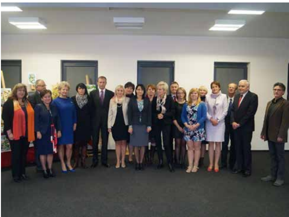
Powinszowania oraz życzenia dla dyrektorów i nauczycieli złożyli przedstawiciele władz gminy.