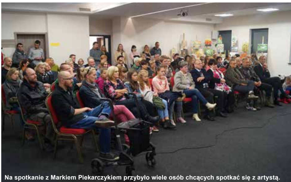
Na spotkanie z Markiem Piekarczykiem przybyło wiele osób chcących spotkać się z artystą.