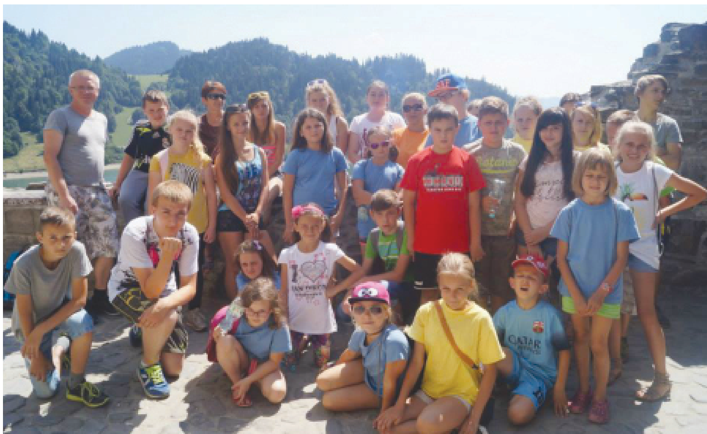
Piękne i ciekawe miejsca w Szczawnicy i okolicach mogli odwiedzić nasi tegoroczni koloniści.

W piątym dniu odbył się kolonijny chrzest - pobrudzeni węglem ale uśmiechnięci uczestnicy kolonii świetnie bawili się przy zorganizowanym na wie-