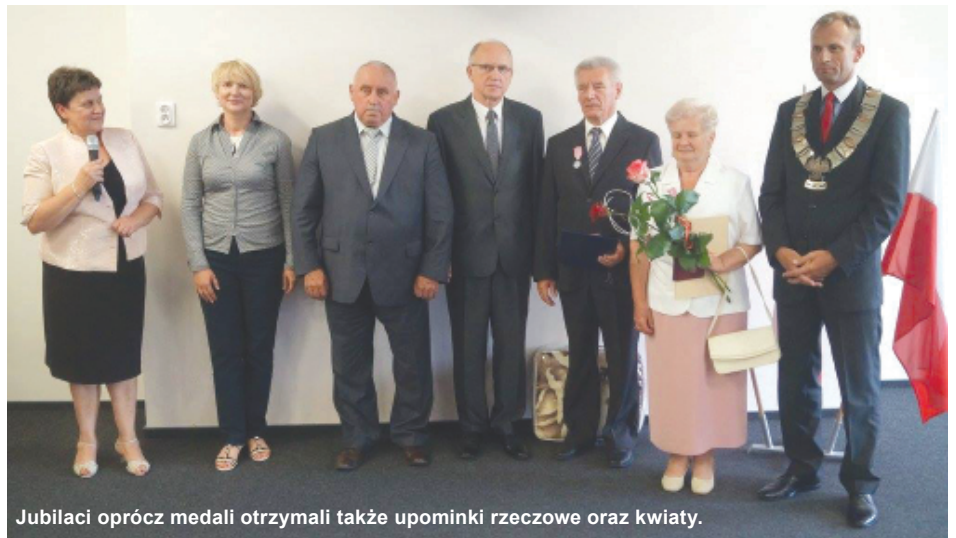
Jubileaci oprócz medali otrzymali także upominki rzeczowe oraz kwiaty.