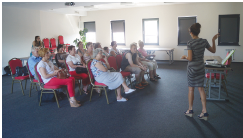
Natomiast podczas spotkań z dietetykiem można było dowiedzieć się co to znaczy zdrowo jeść.

wystrzegać, a po jakie sięgać częściej. Podobnie spotkanie przebiegało w Piekoszowie 6 lipca i w Brynicy 16 lipca.