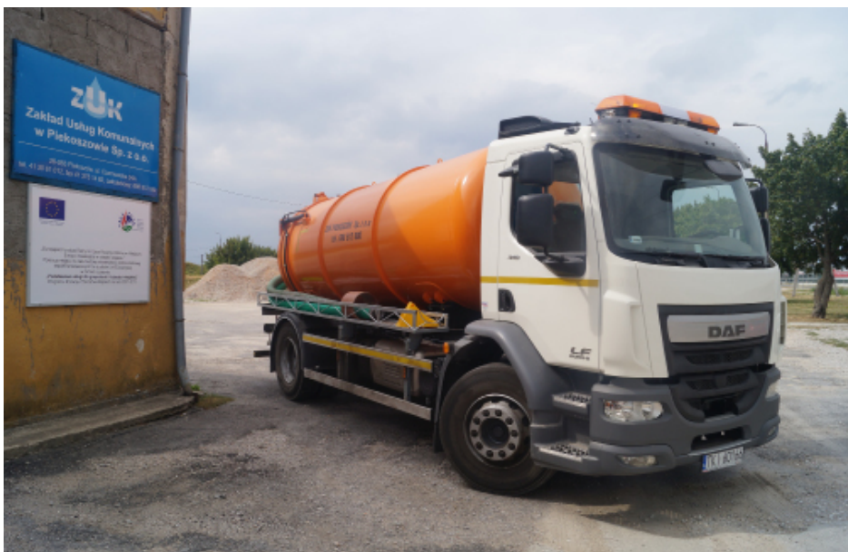
Zakupiony przez ZUK wóz asenizacyjny już wykonuje usługi dla mieszkańców.

Do podanych wartości należy doliczyć podatek VAT w wysokości 8%.