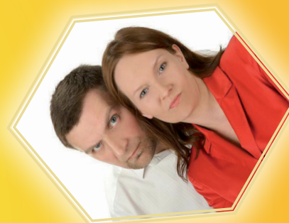
*Kabaret SAKREBLE (laureaci Przeglądu Kabaretowego PAKA)