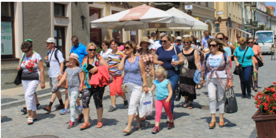
Mimo upalnej pogody chętnie podziwialiśmy urokliwy sandomierski rynek.