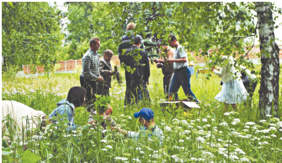
Nasi podopieczni podczas wspólnego zbierania ziół.