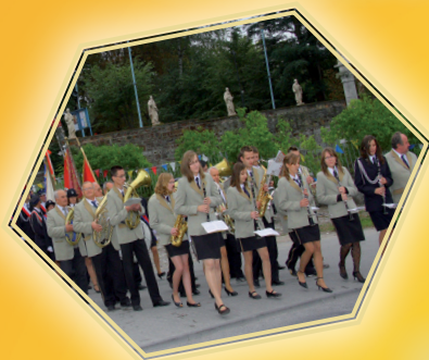
*130-lecie Orkiestry Dętej z Piekoszowa

MSZA ŚW. O GODZ 12 00 W KOŚCIELE NNMP W PIEKOSZOWIE