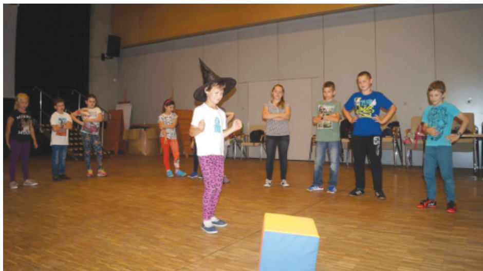
Podczas wycieczki do Pacanowa dzieciaki uczestniczyły w ciekawych animacjach.

Krótko mówiąc dzieciaki nie mogły narzekać na nudę. Każdy dzień wypełniony był nowymi wyzwaniem i atrakcjami, a poza tym zawarte zostały nowe znajomości pomiędzy uczestnikami, co również jest bardzo ważne.