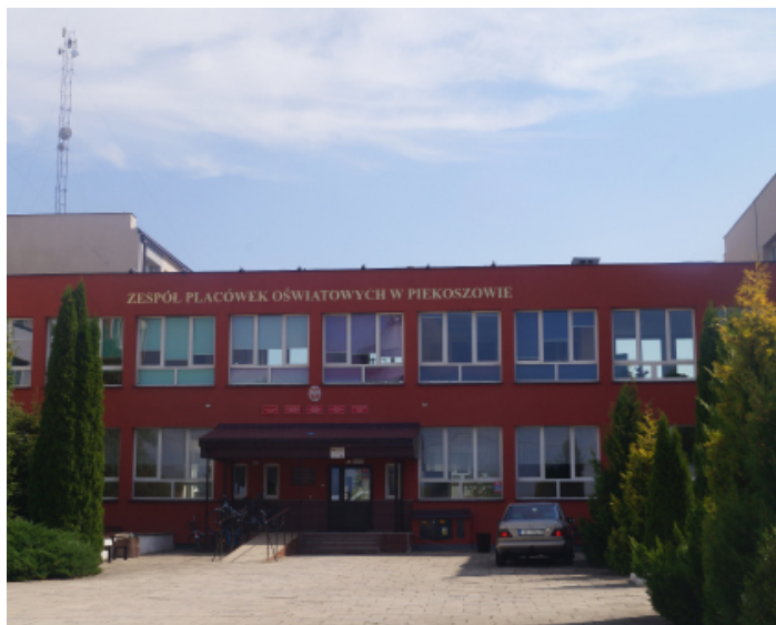
Zespół Placówek Oświatowych w Piekoszowie dzięki termomodernizacji zyskał nową, estetyczną elewację.