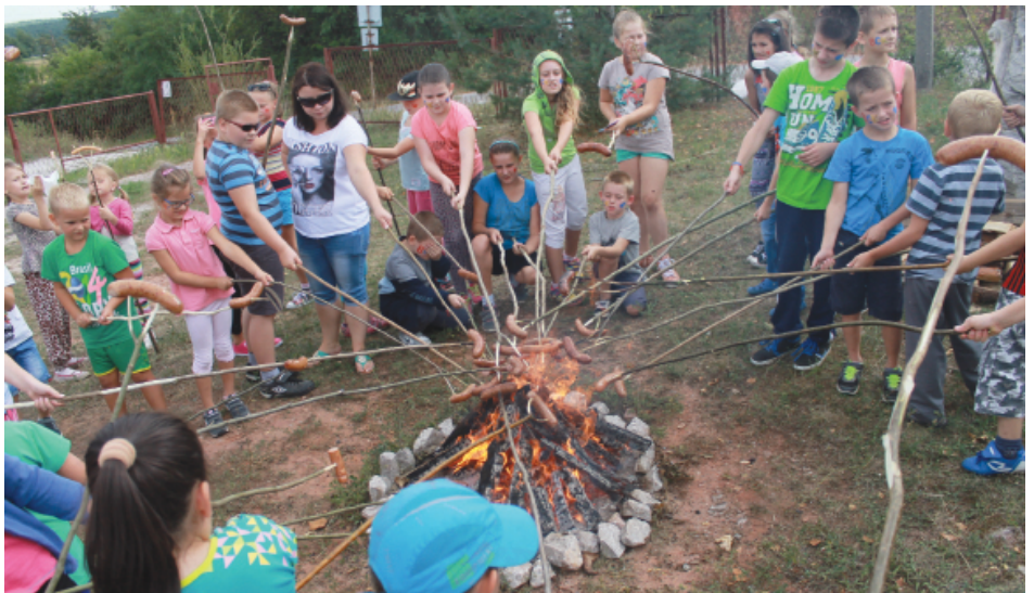
Pogoda pozwoliła nam na organizację ogniska, na którym każdy mógł upiec pyszną kielbasę.