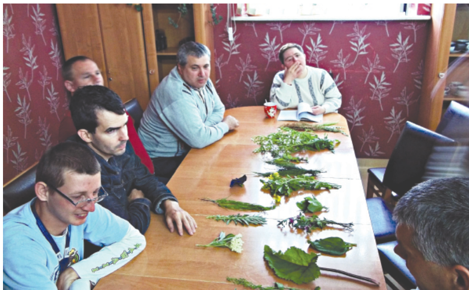
Uczestnicy warsztatów poznali różne zioła i ich właściwości lecznicze.