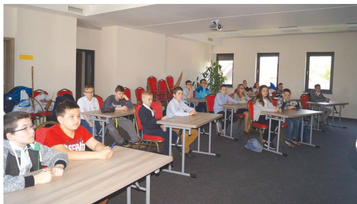
Konkurs wiedzy składał się z trzech etapów - pierwszym był test wiedzy.

Główną atrakcją tegorocznego Tygodnia Bibliotek w Brynicy był turniej wiedzy o Polsce na podstawie słynnego programu telewizyjnego „Kocham Cię, Polsko”.