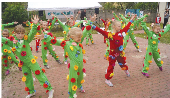
Mini Flowers to nowo powstała grupa taneczna z Zajączkowa.