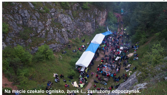
Na mecie czekało ognisko, żurek i... zasłużony odpoczynek.