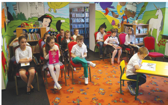
Wśród uczestników mieliśmy wielu debiutantów.

W grupie klas trzecich mieliśmy 7 uczniów, spośród których 6 zajęło miejsce na podium. I tak, na miejscu trzecim ex aequo