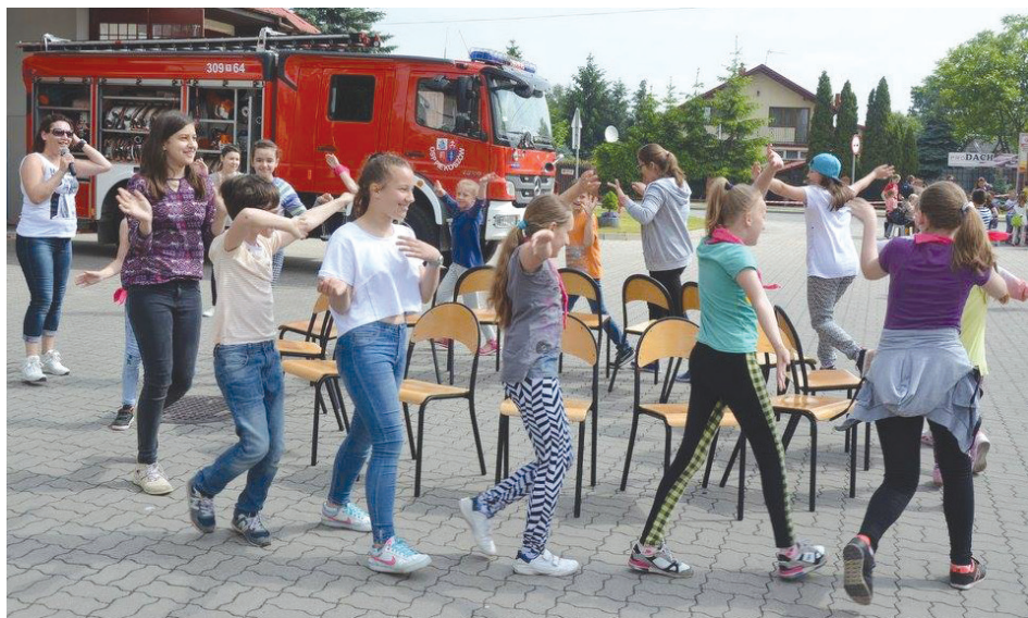
Podczas dnia dziecka zorganizowano wiele zabaw i konkurencji dla wszystkich.

Na łasuchów czekały darmowa wata i popcorn oraz budka z lodami. Co więcej