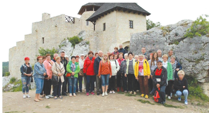
Pięćdziesięcioosobowa grupa mieszkańców zwiedziła jurę.