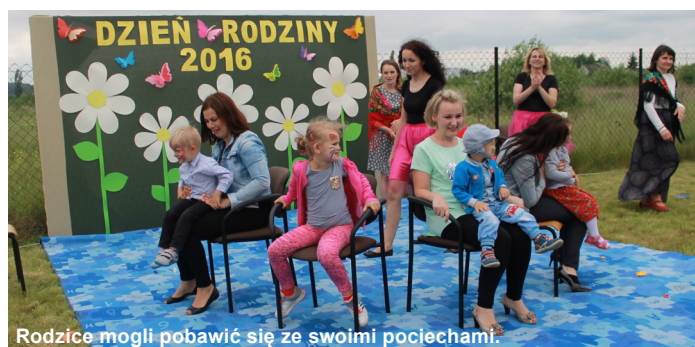
Rodzice mogli pobawić się ze swoimi pociechami.