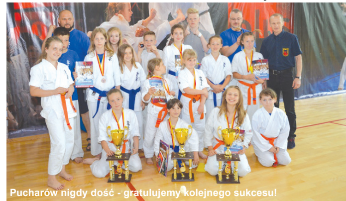
Pucharów nigdy dość - gratulujemy kolejnego sukcesu!