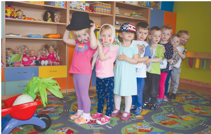
Dzieciaki mogą korzystać z najwyższej jakości sprzętu i zabawek.