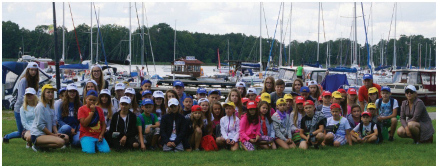
Oprócz atrakcji turystycznych na Mazurach uczestnicy mogli zobaczyć mazurskie porty jachtowe.