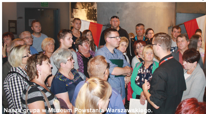
Nasza grupa w Muzeum Powstania Warszawskiego.