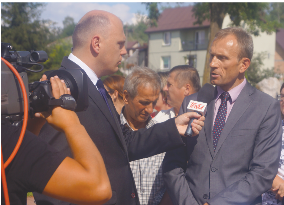
Wójt Gminy Piekoszów podejmuje temat kopalni na wrześniowej sesji rady gminy.

Część mieszkańców Zajączkowa boi się problemów i uciążliwości jakie mogą wyniknąć po otwarciu kopalni w tej miejscowości.