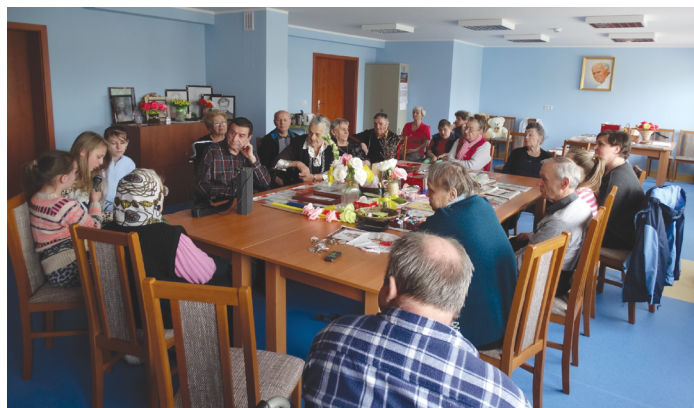
Wolontariuszki ze Strawczyna czytały mieszkańcom Lokali.

Dla mieszkańców przygotowana została specjalna oferta terapii zajęciowych i zajęcia fizjoterapeutyczne. Ciekawą opcją jest także grota solna, która ma zbawienny wpływ na drogi oddechowe, trudności z zasypianiem, stres czy starzenie się skóry. – Z groty solnej może skorzystać każdy. Mamy przygotowane specjalne karnety dla osób indywidualnych oraz rodzin – dodaje ks. Jagielka. Ponadto odbywają się spotkania z animatorem muzycznym, turnusy rehabilitacyjne, wyjazdy na np. Światowe Dni