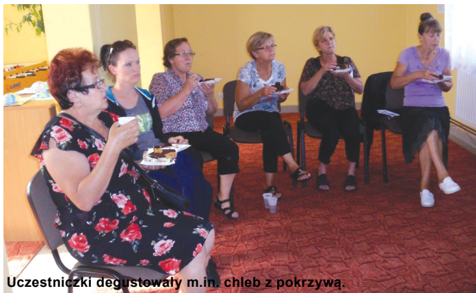
Uczestniczki degustowały m.in. chleb z pokrzywą.

Projekt „Biblioteka - moje miejsce” współfinansowany jest ze środków Ministerstwa Kultury i Dziedzictwa Narodowego