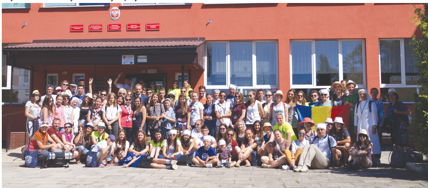
Goście z Rumunii poznali atrakcje naszego regionu oraz tutejszą społeczność. Zawitali również do ZPO w Piekoszowie na wspólny posiłek.