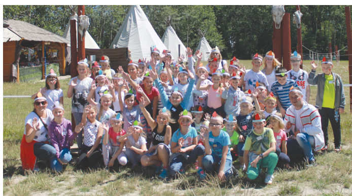
Uczestnicy akcji wakacyjnej z wizytą w indiańskiej wiosce Bonanza.

Wiele uśmiechu było w trakcie zajęć stałych, które podczas wakacji w każdy poniedziałek prowadziły wszystkie placówki Biblioteki Centrum Kultury w Piekoszowie. W świetlicach i bibliotekach organizowane były liczne gry sportowe, zajęcia plastyczne i ceramiczne, projekcje filmowe oraz wiele innych zabaw. Natomiast