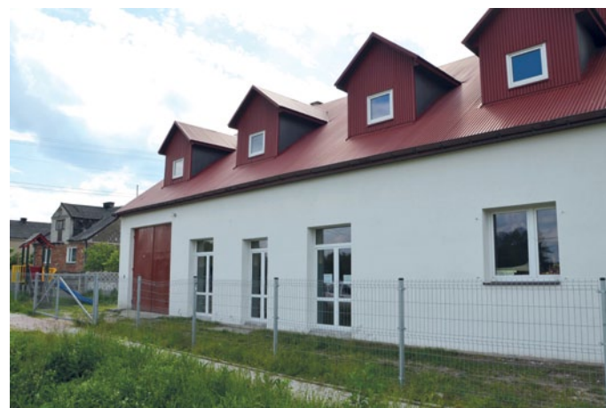
W budynku w którym funkcjonuje przedszkole w Szczukowicach trwa właśnie remont.