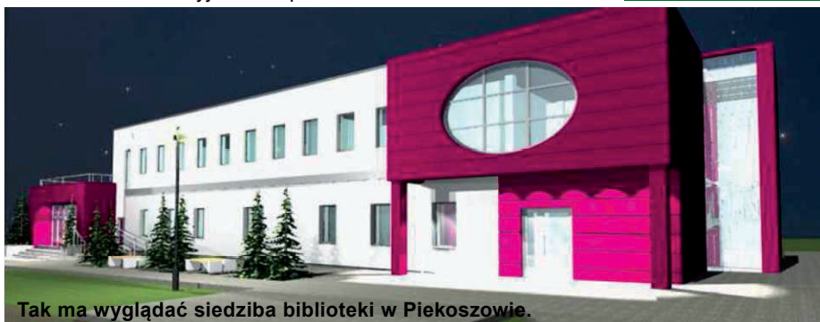
Tak ma wyglądać siedziba biblioteki w Piekoszowie.