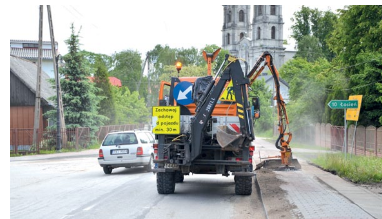
Na ulicach Piekoszowa pracują zamiatarki.

Maszyny pracują na trasach wojewódzkich. Zgodnie z zapowiedziami pracowników Zarządu Dróg Wojewódzkich w Kielcach, posprzątanie chodników ma zająć kilka dni.