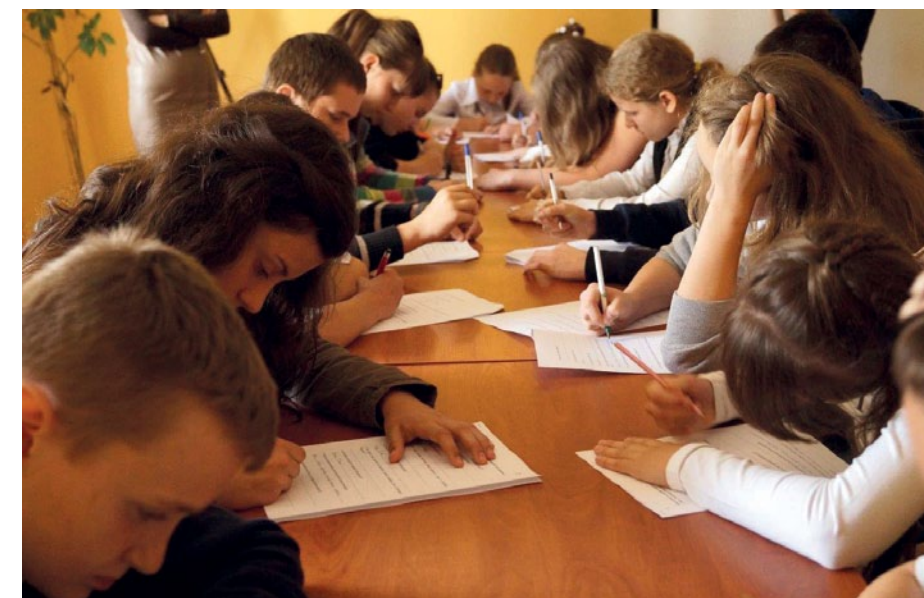
Sporym zainteresowaniem cieszył się konkurs czytelniczy pod tytułem „Ania Shirley i inni bohaterowie Lucy Maud Montgomery’ego.”