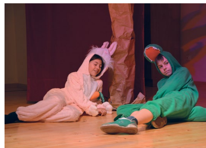
Aktorzy zadbali o odpowiedni dobór tekstów i strojów.

W tym roku uczestnicy wiosny teatralnej mieli wystąpić na niedawno oddanej do użytku po remoncie sali teatralnej Gminnego Ośrodka Kultury. - Zupełnie inaczej się na niej gra. Jest nowe kolorowe oświetlenie, scena jest po prostu profesjonalna. Teraz inaczej się na niej występuje - usłyszeliśmy od jednej z uczestniczek imprezy.