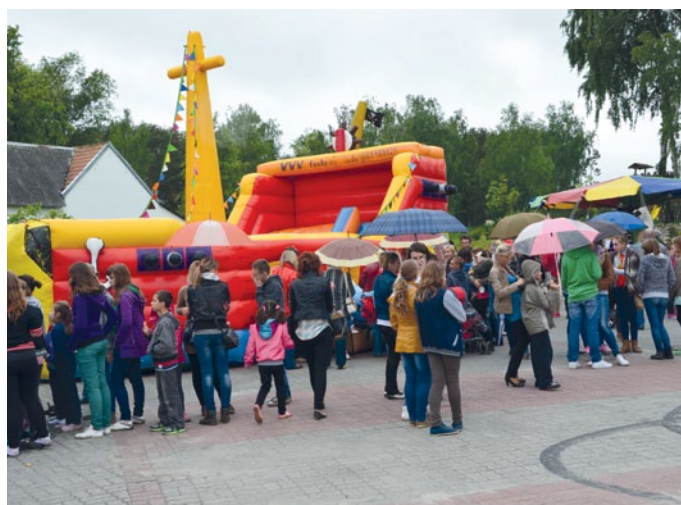
Dzieci oblegali statek - zjeżdżalnię oraz trampolinę.

Niesprzyjająca aura nie była w stanie popsuć zabawy najmłodszym mieszkańcom gminy, którzy na placu przed Gminnym Ośrodkiem Kultury w Piekoszowie świętowali Dzień Dziecka