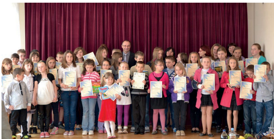
Uczestnicy ogólnopolskiego konkursu plastycznego.