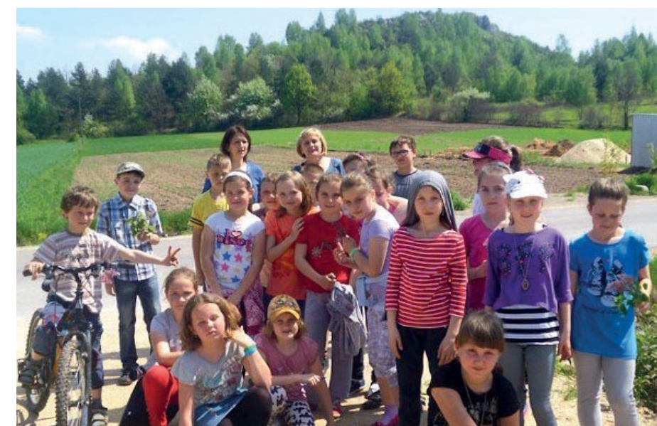
W Zajączkowie najmłodsi czytelnicy biblioteki mogli wraz z opiekunami aktywnie spędzić czas.