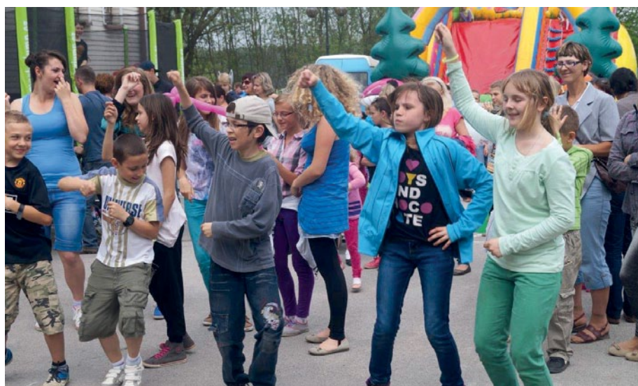
Dzieci i młodzież bawiła się znakomicie