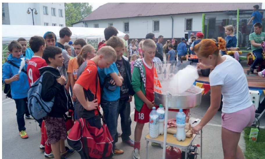
Przed stoiskiem z watą cukrową ustawiała się długa kolejka.

Dzień Otwarty Biblioteki organizowany w ramach Tygodnia Bibliotek w piekoszowskiej placówce zawsze obfituje w niecodzienne atrakcje.