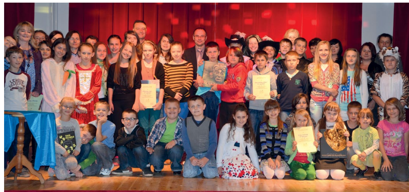
Uczestnicy tegorocznej Wiosny Teatralnej mieli okazję wystąpić na nowej oddanej niedawno po remoncie scenie GOK.