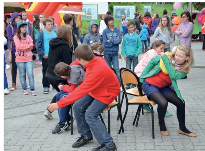
Było mnóstwo gier i konkursów dla dzieci.