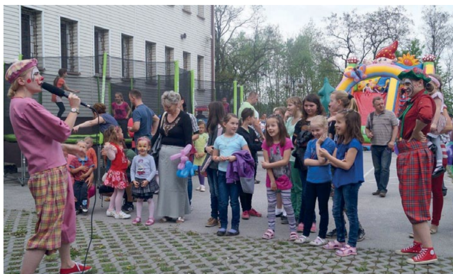
Aktorzy w strojach klaunów zabawiali przybyłych na piknik.

Największa impreza organizowana już po raz piąty przez Gminną Bibliotekę Publiczną w Piekoszowie przyniosła najmłodszym i nie tylko dużo zabawy i uśmiechu