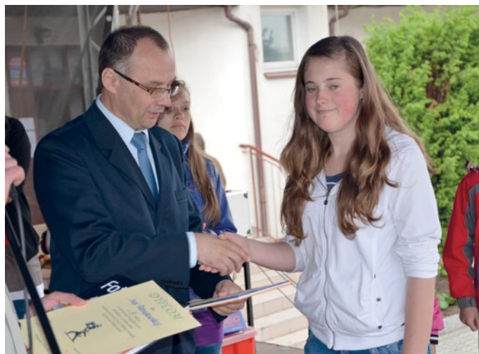
Nagrodzono także zwycięzców konkursu fotograficznego.

Wręczono także nagrody zwycięzcom konkursu fotogra-