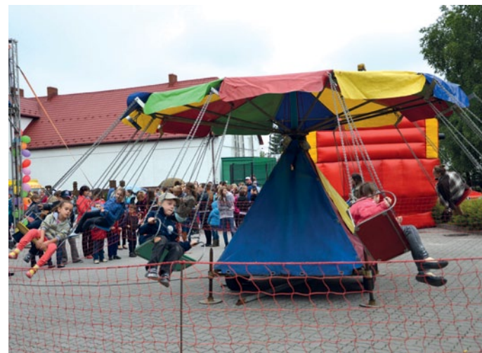
Nie lada atrakcją dla dzieci okazała się karuzela.