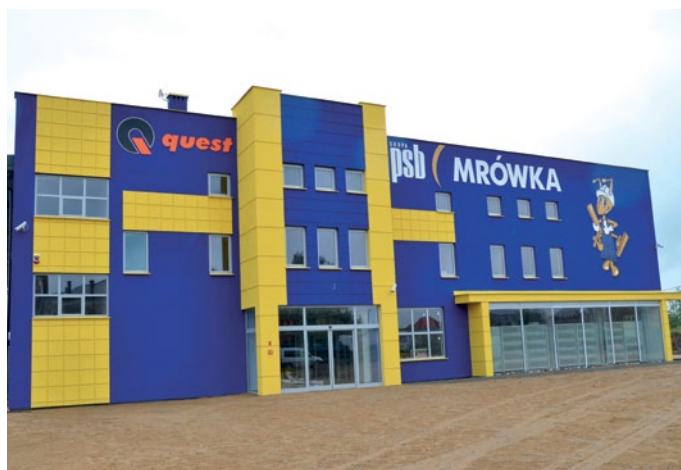
Market budowlany Mrówka mieści się za biurowcem po Państwowym Gospodarstwie Ogrodniczym w Piekoszowie.

W sobotę 8 czerwca w Piekoszowie otwarcie marketu budowlanego, znanej polskiej sieci handlowej. Będzie można kupić wiele produktów po atrakcyjnych cenach i wygrać nagrody!