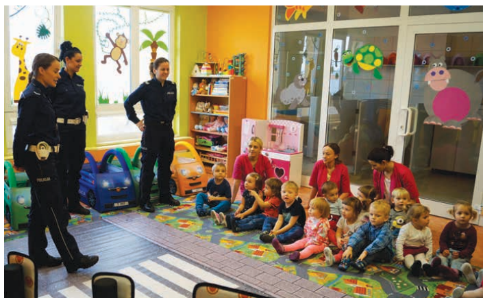
Policjantki wyjaśniły najmłodszym na czym polega bezpieczne zachowywanie się na drodze.