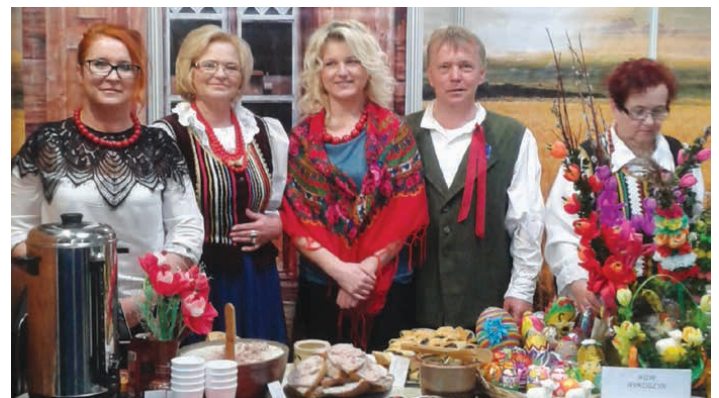
Reprezentanci gminy Piekoszów na targach Agrotravel.

społy ludowe, pieśni i tańce folklorystyczne, rękodzielnictwo i wyroby artystyczne. /kg/