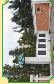
Ściana Straceń upamiętniająca żołnierzy Armii Krajowej w Zwoleniu