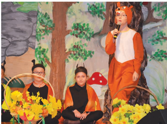
Laureaci pierwszego miejsca w kategorii klas I-III - uczniowie Szkoły Podstawowej w Gnieździskach.