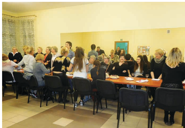
W świetlicy w Wincentowie wszystkie panie brały udział w licznych grach i zabawach. (fot. archiwum BCK)