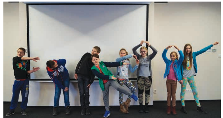
Układanie liter ze swoich ciał to nie taka prosta sprawa. Na zdjęciu widnieje napis... Facebook.

Na dwóch ostatnich spotkaniach w Piekoszowie i Rykoszynie była mowa o cyberprzemocy i wpływie udostępniania kompromitujących zdjęć lub filmów z udziałem innych osób. – Taki sposób wyśmiewania się z innych może mieć naprawdę tragiczne skutki – mówiła prowadząca spotkanie. Podczas zajęć duży nacisk położono na kontakty przez Internet z osobami nieznanymi. – Ktoś może pisać, że ma 10 lat, a w rzeczywistości ma 40 i chce nas skrzywdzić – mówili uczniowie. /kg/