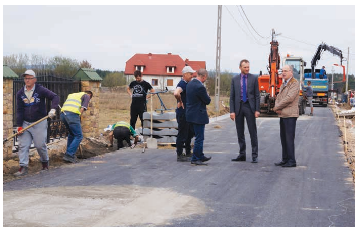
Ulica Różana w Rykoszynie zyskała nowy, lepszy wygląd.

W Bławatkowie przebudowane zostają ul. Leśna na odcinku 449 mb oraz ul. Wiosenna 453 mb wraz z łącznikiem o długości 82 mb. Wartość robót to ponad 528 tys. zł. z czego 63,63 %, czyli ponad 325 tys. zł. zostało pozyskana z Programu Rozwoju Obszarów Wiejskich na lata 2014-2020. W ramach kontraktu powstaje jezd-