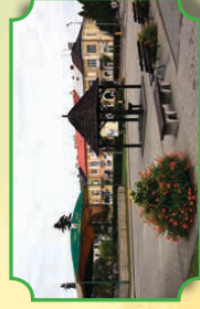
Rynek w Zwoleniu