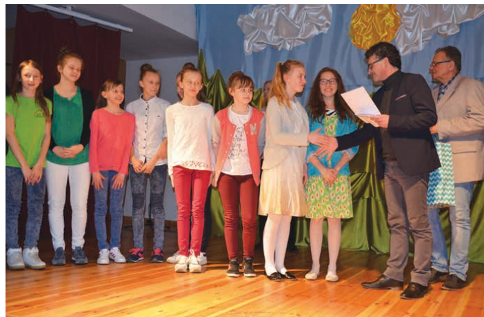
Nagrodzone grupy teatralne otrzymały upominki oraz pamiątkowe dyplomy.

Po wręczeniu dyplomów, nagród i gratulacji w młodszych kategoriach, rozpoczęto ostatnią część festiwalu – prezentacje klas IV-VI. W tej kategorii wiekowej trzecie miejsce zajęli uczniowie z Brynicy, drugie – z Micigozdu, a ex aequo na pierwszym znaleźli się przedstawiciele szkoły w Szczukowskich Górkach oraz szkoły w Korczynie. /kg/