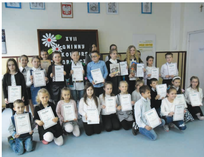
Uczestnicy konkursu ortograficznego