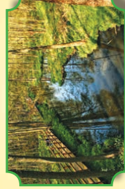
Park krajobrazowy, Puszcza Kozieniicka, Rezerwat Przyrody „Królewskie źródła”