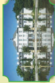
Zespół pałacowo-parkowy w Kozienicach