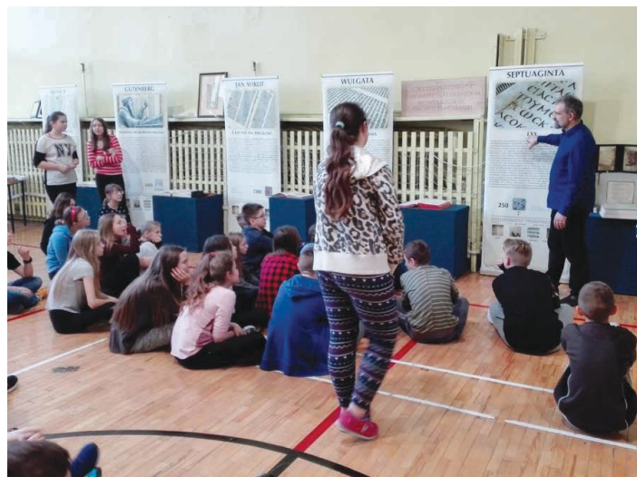
Wystawa zawierała w sobie mnóstwo historii i ciekawostek.