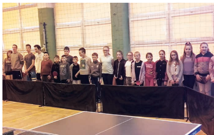
Pierwszy z serii trzech turniejów znalazł swoich fanów.