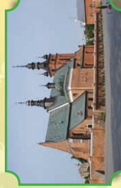
Kościół Podwyższenia Krzyża wraz z kaplicą Kóchanowskich w Zwoleniu