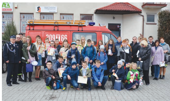
Uczestnicy Konkursu Wiedzy Pożarniczej wraz z nauczycielami przygotowującymi ich do konkursu.

- Wiedza pożarnicza, którą zaprezentowaliście podczas dzisiejszego konkursu na pewno w trudnych sytuacjach będzie przydatna – mówił wódczyni gminy Piekoszów Zbigniew Piątek wręczając nagrody poszczególnym laureatom. /kg/