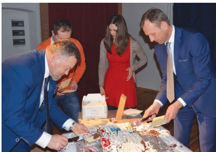
Na zakończenie wydarzenia każdy z gości otrzymał kawałek pysznego tortu.

Blisko godzinny koncert przyniósł bardzo licznej publiczności wiele atrakcji. Oprócz wspólnego śpiewania takich przebojów jak „Kochaj mnie kochaj”, „Nie będę Julią” czy „Hi-Fi”, była również nauka... tańca. W trakcie utworu „Kanonady, galopady” publiczność musiała wykonywać pokazywane przez artystkę ruchy taneczne. Śmiało można stwierdzić, że mamy świetnych tancerzy w gminie.