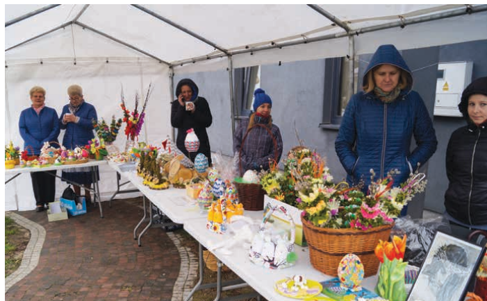
Ręcznie wykonane palmy wielkanocne z roku na rok cieszą się niegasnącym zainteresowaniem.