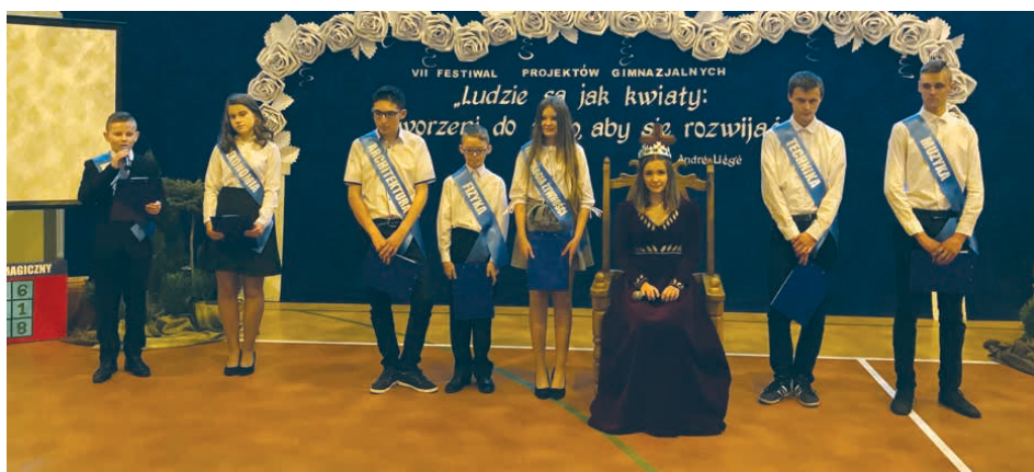
Jak co roku gimnazjaliści ze szkoły w Łosieniu świetnie się zaprezentowali.