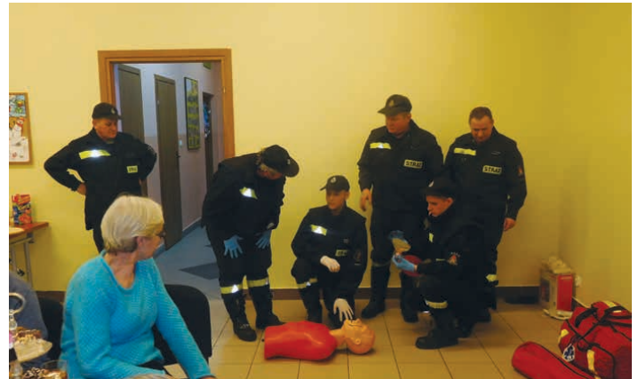
Strażacy dali pokaz pierwszej pomocy.