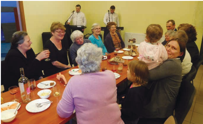
Uśmiechy na twarzach świadczyły o świetnej atmosferze.