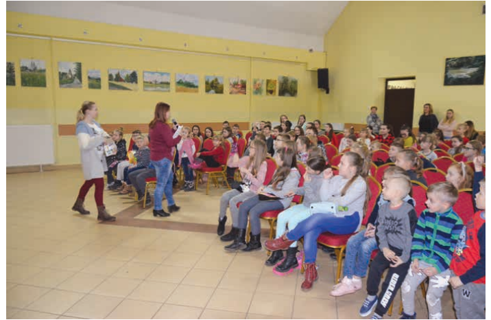
Dla dzieci zorganizowane zostały także gry i zabawy w postaci np. zgadzywanek. (fot. BCK)

Oprócz aktorów Teatru Maska, gościliśmy również przedstawicieli policji oraz straży pożarnej. Ci pierwsi – reprezentanci komisariatu z pobliskich Chęcín – przestrzegali dzieci przed niebezpieczeństwami jakie grożą im na drodze, jeśli bacznie się nie rozglądają lub nie pilnu-