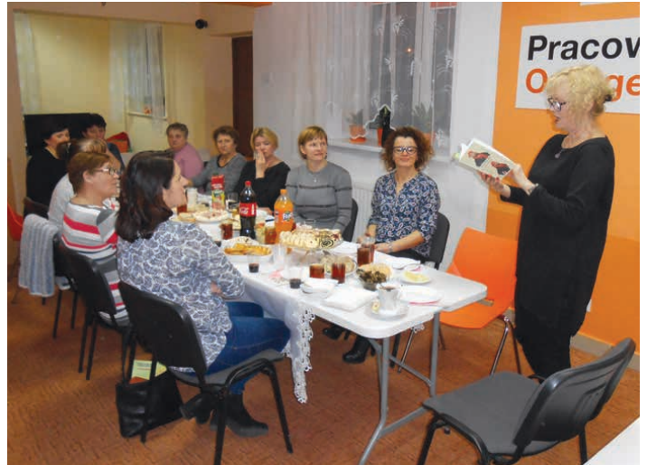
Pisarka czytała także swoje wiersze. Na zdjęciu - Zajączków.

Nie wiem, co robią wiosną w Zajączkowie zające. Pewnie marchewkę skrobią i kocą się na łące. Natomiast tutejsze panie do biblioteki biegną Bo lubią książek czytanie i karmią się wiedzą.