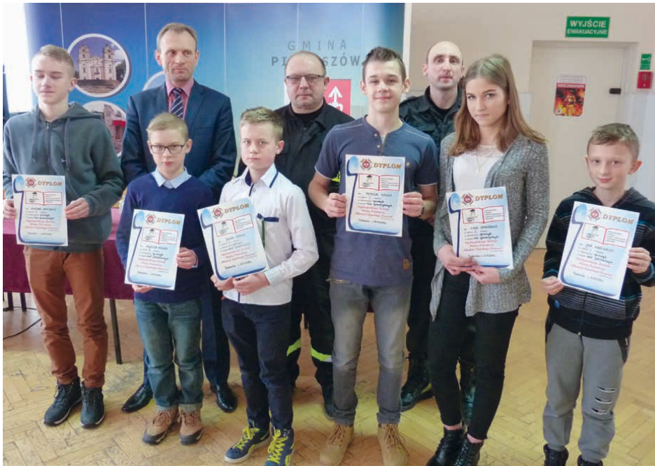
Laureaci poszczególnych kategorii konkursu.