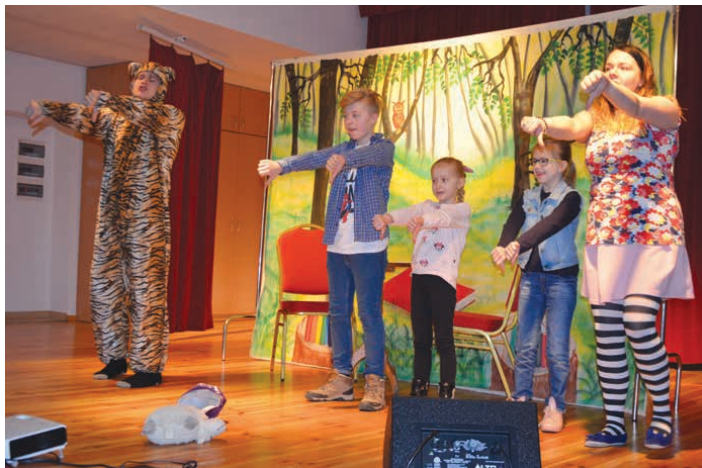
Aktorzy grający w spektaklu zaprosili do wspólnej zabawy młodą publiczność.

Zwłaszcza jeśli mowa o spektaklu Teatru Maska z Krakowa, który gościł na piekoszowskiej scenie w dniu zakończenia akcji „Ferie 2018”. Przedstawienie opowiadało o niegrzecznej dziewczynce o imieniu Karolinka, która nie słuchała rodziców, bałaganiała i nie potrafiła zachowywać się grzecznie. Jednak po pewnym czasie, w efekcie kilku niezwykłych okoliczności, dziewczynka zrozumiała swój błąd i poprawiła swoje zachowanie. – Czy teraz wiesz jakie są te trzy magiczne słowa, które powinnaś wypowiedzieć jak najczęściej? – pytał jeden z bohaterów spektaklu, Pan Żaba. – Czary mary? Abracadabra? – żartowała dziewczynka wywołując salwy śmiechu wśród widzów. – Nie! – krzyknął Pan Żaba. – Oj, żartowałam. Te słowa to PROSZĘ, DZIĘKUJĘ I PRZEPRASZAM – powiedziała Karolinka, która dodatkowo podkreśliła – a wręcz nakazała wszystkim – by używać ich często, bo są w życiu bardzo potrzebne i dobrze o nas świadczą.