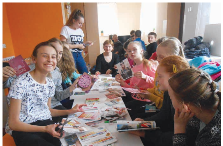
W bibliotece w Zajączkowie poruszono temat internetowego „hejtu”. Szukano sposobów jak sobie z nim radzić.