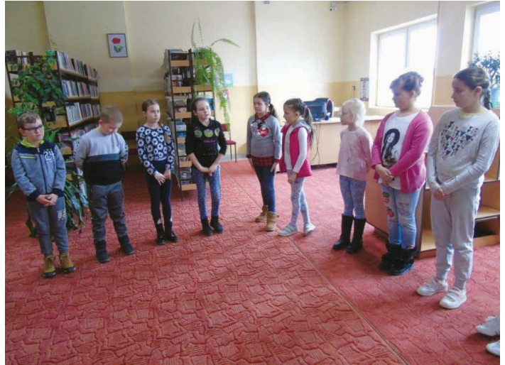
W Rykoszynie uczniowie dyskutowali o niebezpieczeństwach czekających w Internecie.

Rozmawiano o tym jak ważny jest Internet, co można dzięki niemu zrobić i jak się ustrzec przed niebezpieczeństwami, które w nim czyhają. Uczniowie poznali zasady bezpieczeństwa i kulturalnego korzystania z Internetu a następnie rozwiązywali quizy nawiązujące do tematu spotkania.