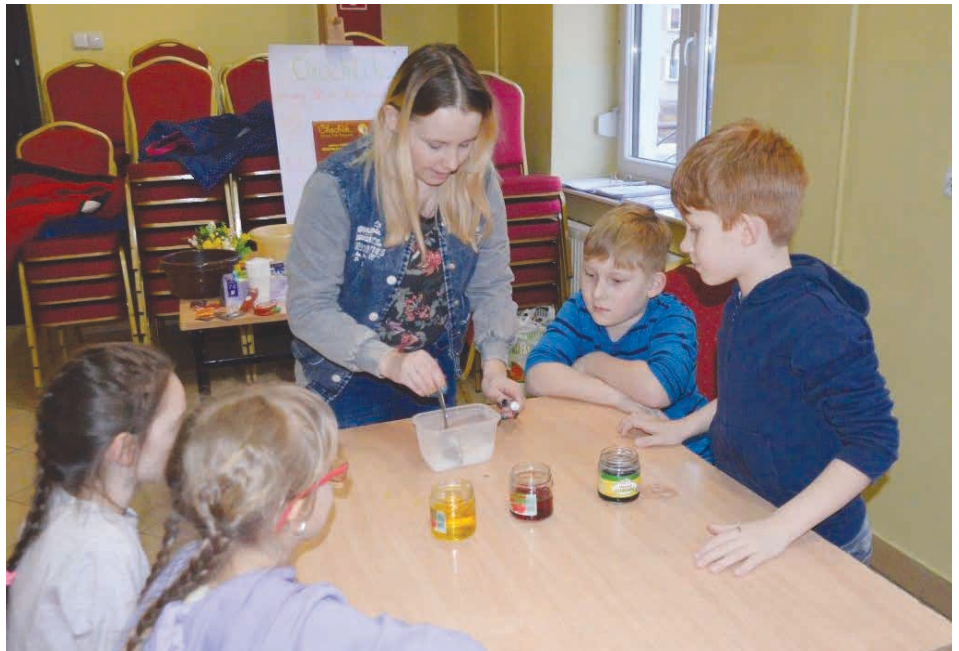
Uczestnicy klubu podczas tworzenia kolorowych wulkanów.

Na kolejnych spotkaniach dzieci wykonywały m.in. wybuchające wulkany czy gniotki DIY z żelatyny z użyciem kolorowych cekinów i brokatu. Samo