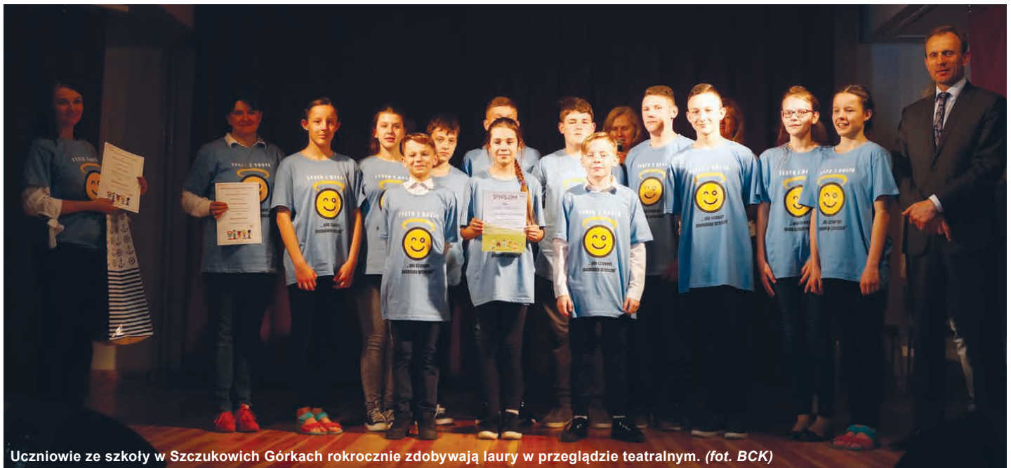
Uczniowie ze szkoły w Szczukowich Górkach rokrocznie zdobywają laury w przeglądzie teatralnym.