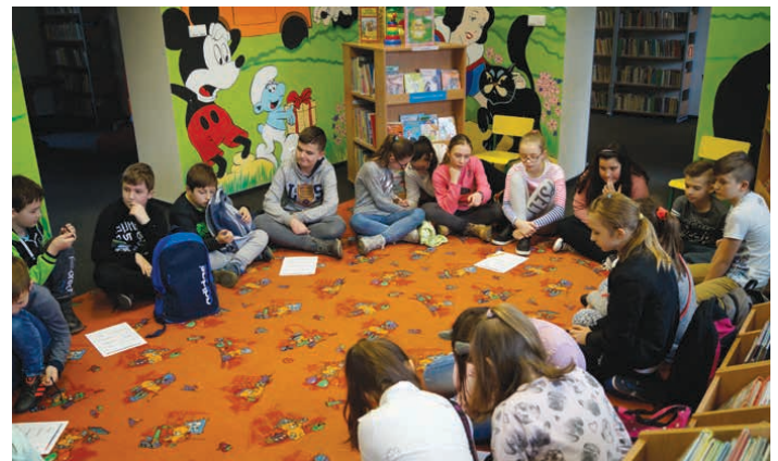
Uczniowie rozwiązywali łamigłówki związane z „hejtem”.