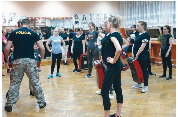
W ćwiczeniach bierze udział wiele pań, które chcą się dowiedzieć, jak zachowywać się w przypadkach zagrożenia.