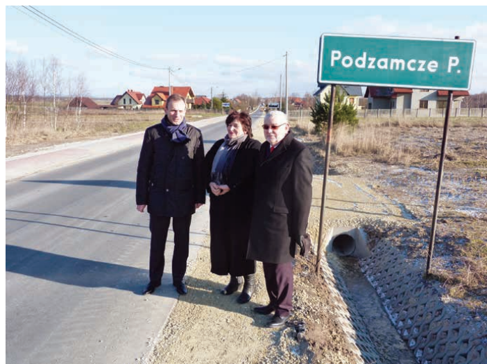
Mieszkańcy mogą już cieszyć się nową, bezpieczną drogą.