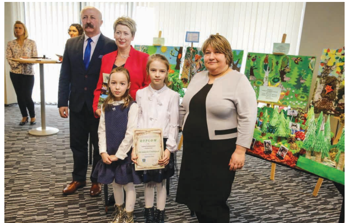
Laureaci pierwszego miejsca tuż po odebraniu nagrody.

W piątek 23 marca przedstawiciele klasy pierwszej wraz z wychowawczynią wzięli udział w uroczystym podsumowaniu konkursu, otrzymali dyplom i nagrody rzeczowe w postaci materiałów edukacyjnych, przyrodniczych, sprzętu sportowego i elektronicznego o łącznej wartości 1 500 zł.