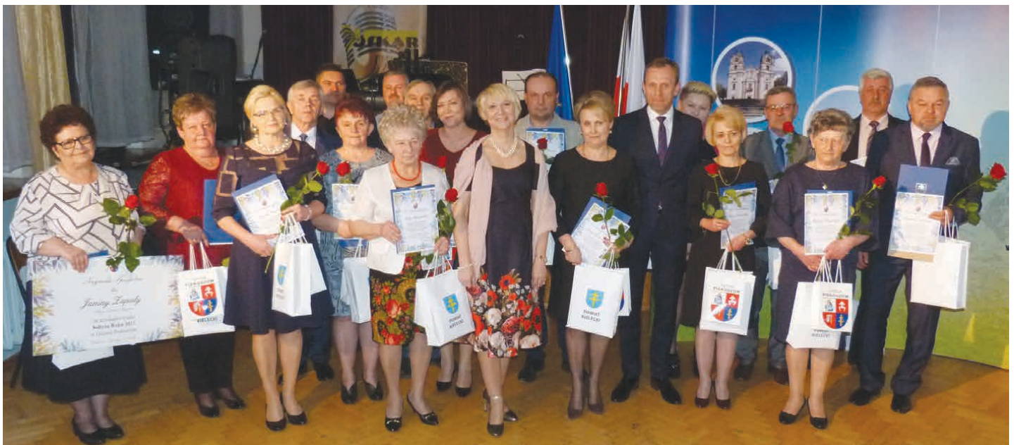
Na uroczystość przybyli prawie wszyscy sołtysi z terenu gminy Piekoszów.