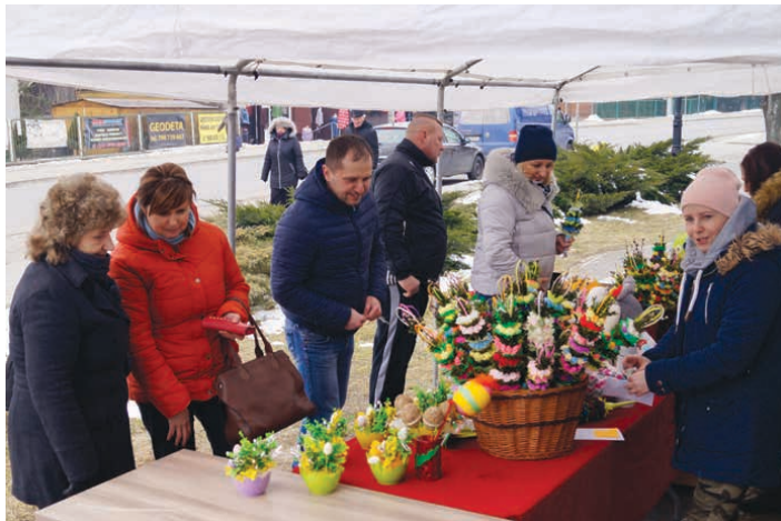
Kosze pełne palm opróżniły się bardzo szybko.