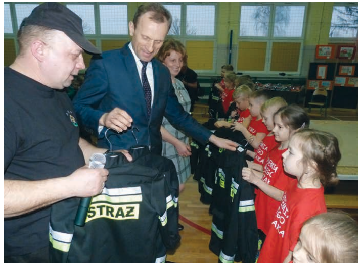
Mali strażacy otrzymali mundury.

bawem będą przekazywać nabyte umiejętności swoim rówieśnikom z innych szkół nie tylko na terenie gminy Piekoszów.