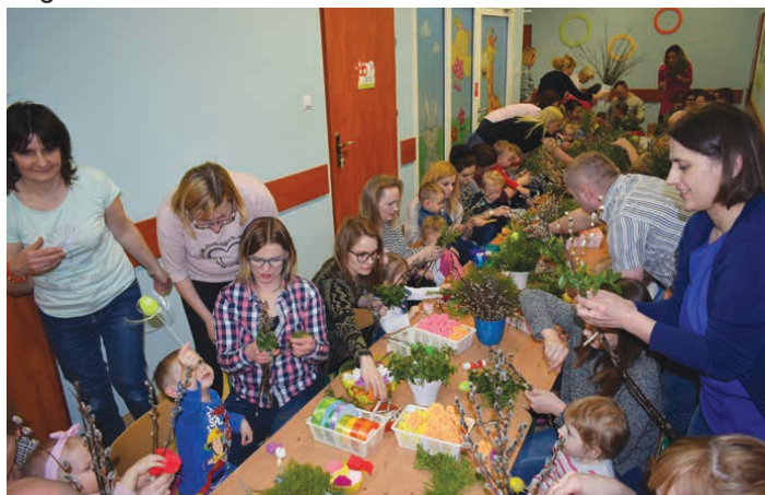
Palmy, które powstawały w rękach najmłodszych i ich rodziców były pięknie ozdobione różnokolorowymi dodatkami.