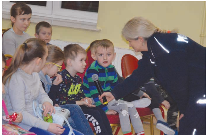
Uczestnicy ferii z BCK podczas spotkania z policjantami odpowiadali na pytania dotyczące np. kontaktów z nieznajomymi.

ją rodziców. – A co zrobicie gdy ktoś nieznajomy będzie chciał poczęstować was cukierkami? – pytali policjanci. – Nie weźmiemy ich, bo może nas w ten sposób gdzieś zwabić, porwać – odpowiadały zgodnie z prawdą dzieciaki. Natomiast przedstawiciele Ochotniczej Straży Pożarnej z Rykoszyna pokazali młodym widzom jak udzielana jest pierwsza pomoc podczas wypadku, jak przenoszeni są ranni, jak wygląda strój strażaka biorącego udział w akcji gaśniczej oraz przypomnieli wszystkie ważne telefony alarmowe.