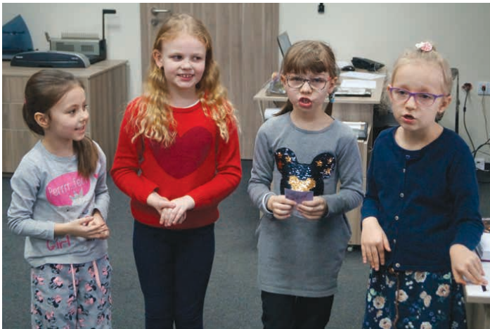
Uczniowie podzieleni na grupy mówili jaka osoba ukrywa się pod konkretnym awatarem.

Głównym tematem spotkania było udostępnianie informacji o sobie w Internecie. – Jakich danych nie możemy lub nie powinniśmy podawać w Internecie? – dopytywała prowadząca spotkanie. Dzieci doskonale знаły odpowiedzi: - Imienia i nazwiska, adresu, wieku, numeru konta bankowego, numeru telefonu – mówiły. To wszystko jak najbardziej jest zgodne z prawdą. Poznały także nowe słowa związane z siecią internetową: nick i awatar.