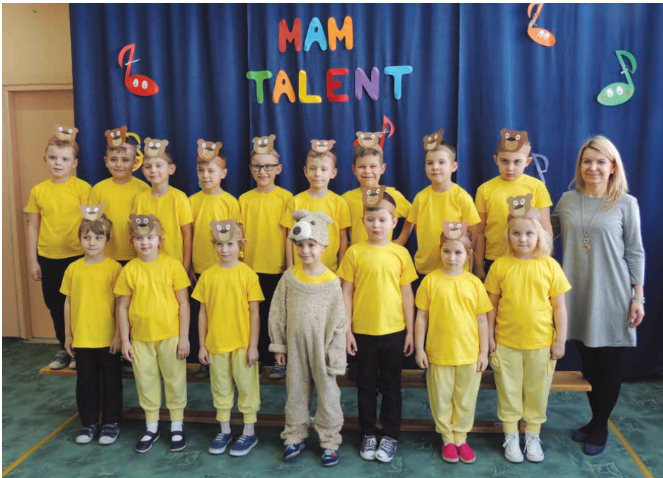
Przedшкоlaki z Piekoszowa pokazały, że mają talent