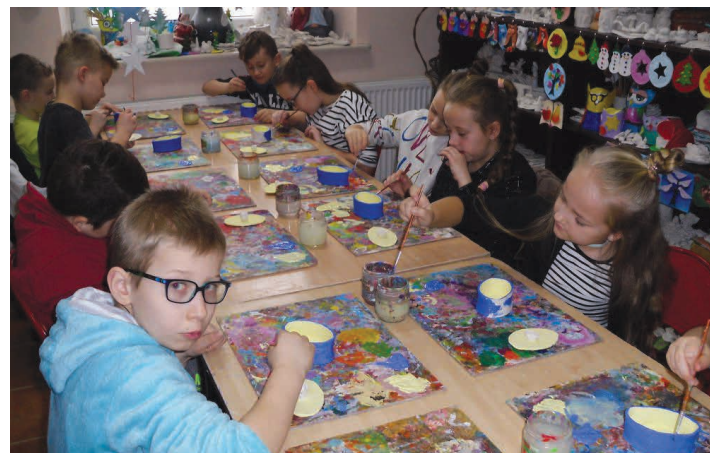
Trzecioklasiści podczas malowania szkatulek.

„Głos Piekoszowa” – dwumiesięcznik bezpłatny samorządu gminy Piekoszków