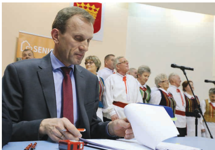
Wójt Gminy Piekoszów podczas podpisywania umowy.

Klub Seniora w Piekoszowie zostanie otworzony do końca września bieżącego roku, a swoją siedzibę będzie miał w budynku Biblioteki Centrum Kultury w Piekoszowie, przy ul. Częstochowskiej 85A (Remiza OSP). - Do dyspozycji seniorów oddamy cztery pomieszczenia. Jedno z nich zostanie przeznaczone na szatnię. W drugim będzie mieścić się kuchnia, która