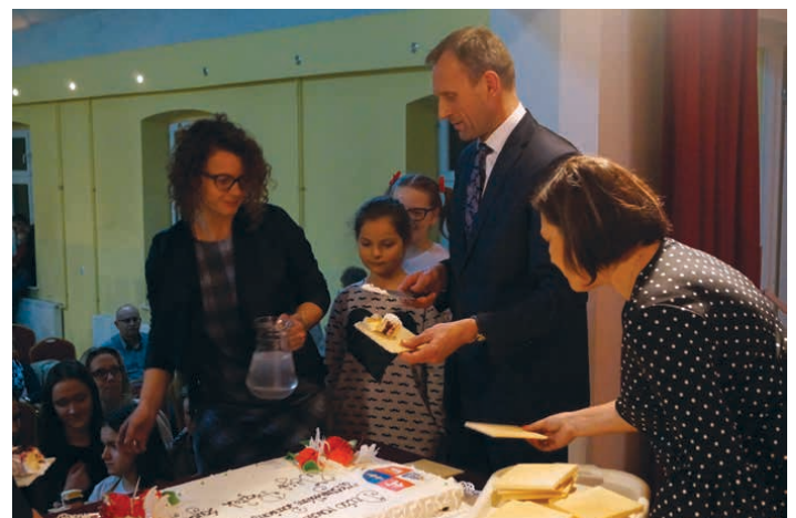
Na wszystkich obecnych czekała słodka niespodzianka - tort.