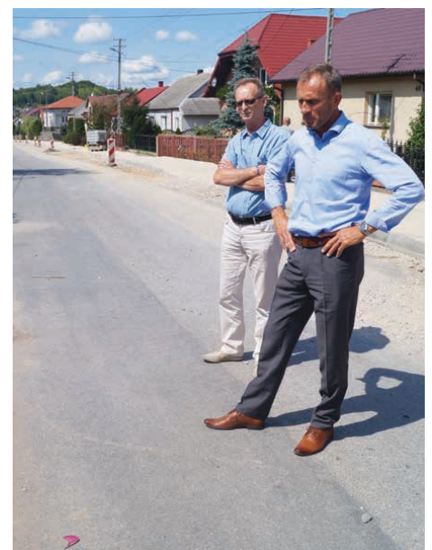
Remont drogi już trwa. W tle wykonany chodnik po jednej ze stron.

Warto dodać, że powstanie tu nie tylko droga i chodnik. Wykonane będzie także odwodnienie. Na jego brak mieszkańcy także narzekali. Jak mówią, w czasie deszczów zalewane były posesje. – Teraz problem ten zostanie całkowicie rozwiązany. W ramach inwestycji zrobimy też porządne odwodnienie. Zależy nam na komforcie życia naszych mieszkańców. Inwestycje staramy się