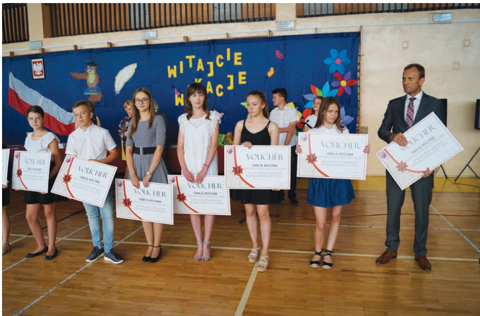
W Piekoszowie wręczono w sumie 17 voucherów.