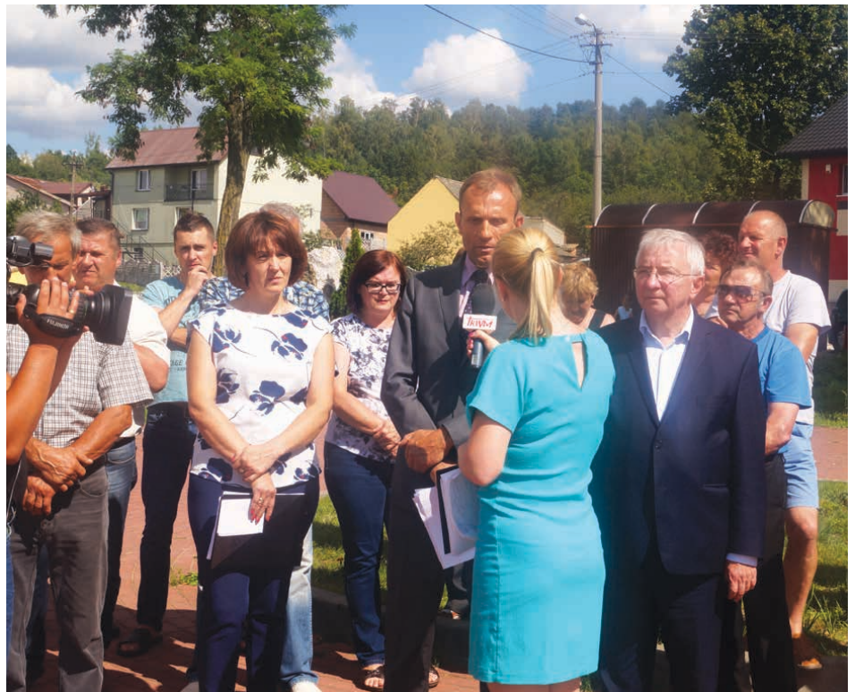
W sprawie kopalni zorganizowany został protest mieszkańców Zajęczkowa i Miedzianki z udziałem władz i mediów.