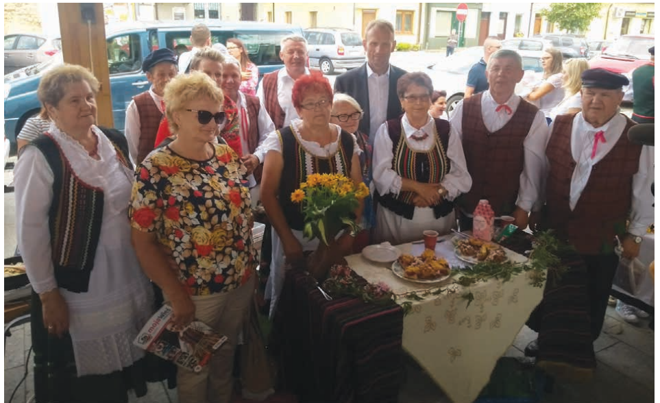
Wójt wspierał reprezentantów gminy podczas konkursu.