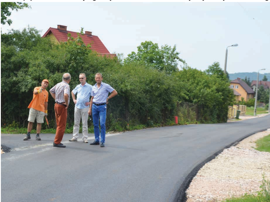
Ulica Zacisze w Rykoszynie już może pochwalić się nową nawierzchnią