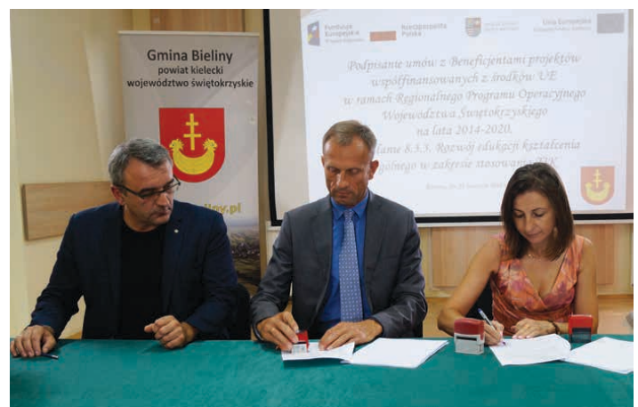
Władze gminy podpisały umowę 21 sierpnia w Centrum Tradycji Gór Świętokrzyskich w Bielinach.