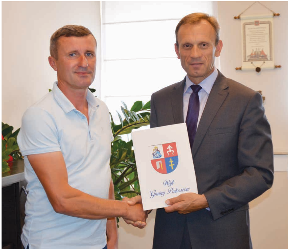
Wójt gminy oraz wykonawca tuż po podpisaniu umowy.

Inwestycja opiewa na kwotę jednego miliona stu tysięcy złotych. Władze gminy Piekoszów pozyskały aż połowę środków na realizację drogi w Zajączkowie w ramach „Programu rozwoju gminnej i powiatowej infrastruktury drogowej na lata 2016-2019”. Zgodnie z założeniami, nowy asfalt położony będzie na długości 877 metrów. Po obu stronach drogi powstaną także chodniki.