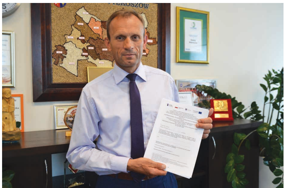
Wójt gminy cieszy się z pozyskanego dofinansowania i podkreśla, że dzięki tej inwestycji będzie nie tylko taniej, ale i bezpieczniej.