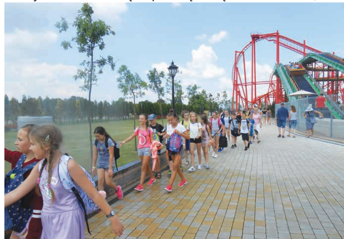
Energylandia dała wszystkim mocny zastrzyk adrenaliny.

Trzecią równie interesującą wycieczką była ta do Farmy Iluzji w Mościskach, gdzie wędrowaliśmy po magicznie zaaranżowanych budynkach i miejscach. Specjalnie ucharakteryzowane pomieszczenia i elementy dawały do myślenia – bo skąd np. wzięła się woda z kranu, któ-