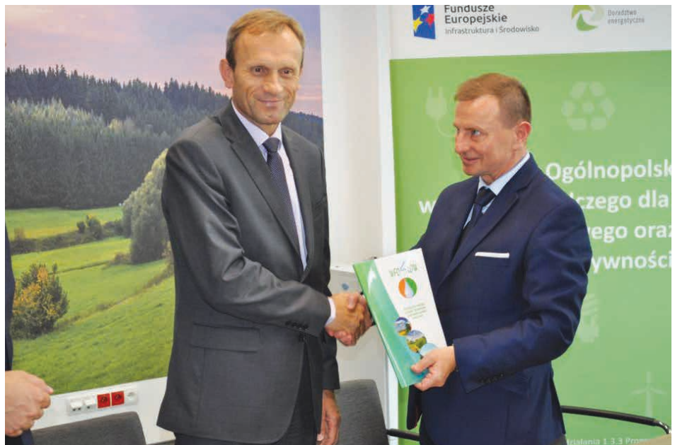
Wójt Gminy Piekoszów podczas podpisywania umowy.

„Głos Piekoszowa” – dwumiesięcznik bezpłatny samorządu gminy Piekoszów