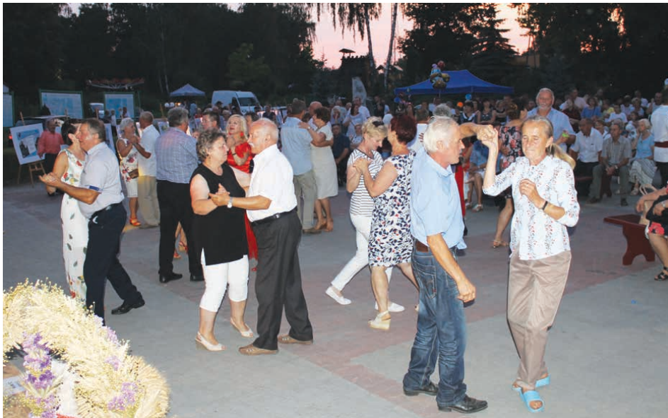
Amatorów tańca nie brakowało.