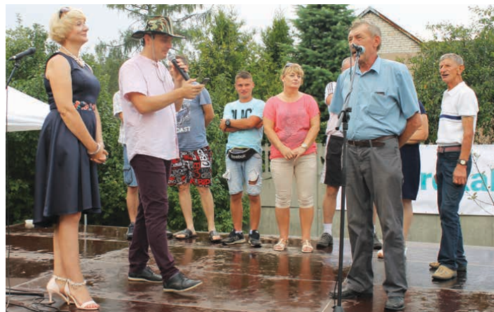
Do konkurencji dla dorosłych przystąpiło wielu chętnych.

A skoro jest festyn to musi też być odpowiednia oprawa muzyczna, a tę zafundowali nam członkowie zespołu Wierna Rzeką, zespół Sensive, MaSza oraz DJ Corby, który zagrał taneczne hity podczas dyskoteki. /kcz/