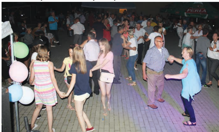
Zabawa taneczna trwała do samej nocy.

Punktami finałowymi imprezy były występy zespołu Braters oraz dyskotekowe hity w wykonaniu DJ Nikosia.