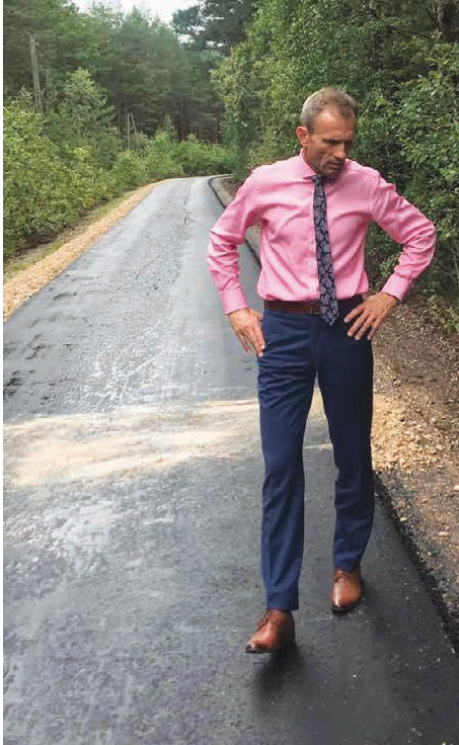
Wójt gminy podczas roboczej wizyty na drodze w Lasku.

Końca dobiegły prace związane z budową drogi Jeżynów-Lasek. Nową nawierzchnię położono na długości 722 metrów.