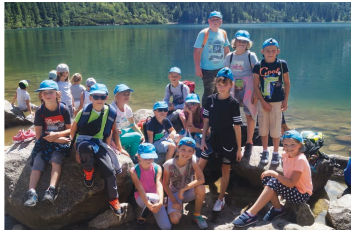
Z wizytą nad Morskim Okiem.

Jako ostatnią odwiedziliśmy Warszawę. Zwiedziliśmy Stadion PGE Narodowy od najwyższych trybun aż do parkingu podziemnego łącznie z lożami VIP (m.in. Lożę Kryształową), kaplicą wielowyznaniową, salą konferencyjną, szatnią, Trybuną Medialną i samą płytą stadionu. Zobaczyliśmy najbardziej ekskluzywne miejsca przezna-