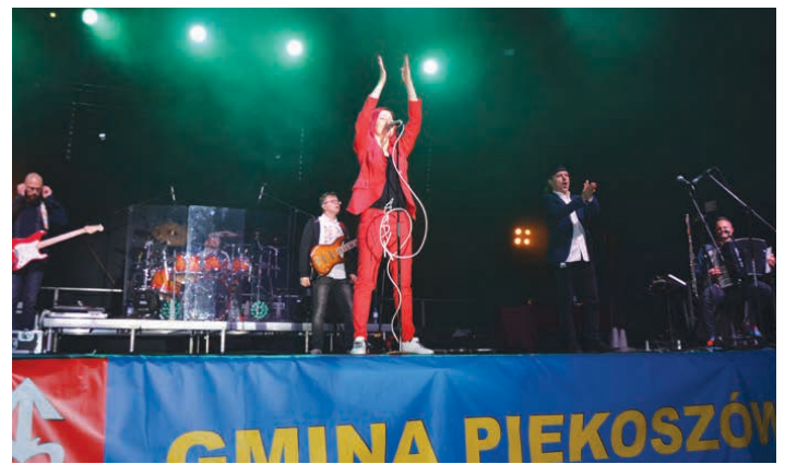
Wokalistka Brathanków - Agnieszka Dyk - pochodzi z Kielc.

Punktem kulminacyjnym imprezy był niewątpliwie występ gwiazdy wieczoru czyli zespołu Brathanki z wokalistką Agnieszką Dyk na czele. Artyści zagrali znane i lubiane piosenki grupy takie jak „W kinie, w Lublinie” czy „Czerwone koraliki” oraz nowe single. Publiczność w aktywny sposób – śpiewając i tańcząc – uczestniczyła w koncercie. Nie tylko Brathanki porywały z miejsca. Zespoły takie jak AS-Klaud, Sensive oraz Oskar nie pozostawały dłużne – nie brakowało chętnych do tańca w rytm energetycznej muzyki.