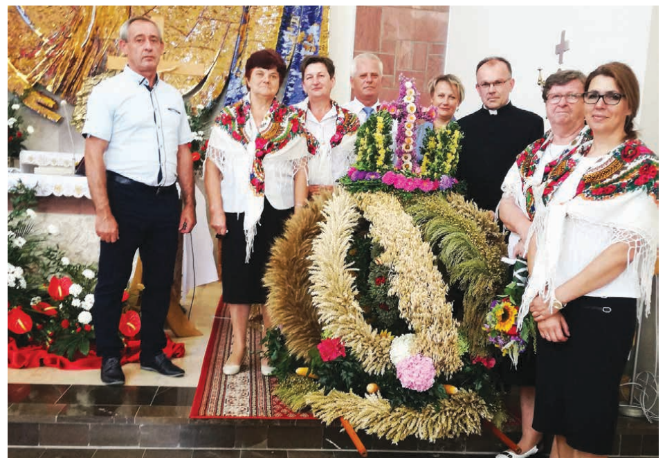
Reprezentaci gminy Piekoszów z parafii Rykoszyn zaprezentowali piękny wieniec w kształcie korony z krzyżem.

mimo deszczowej pogody – prezentował się znakomicie na tle pozostałych wieńców. /kcz/