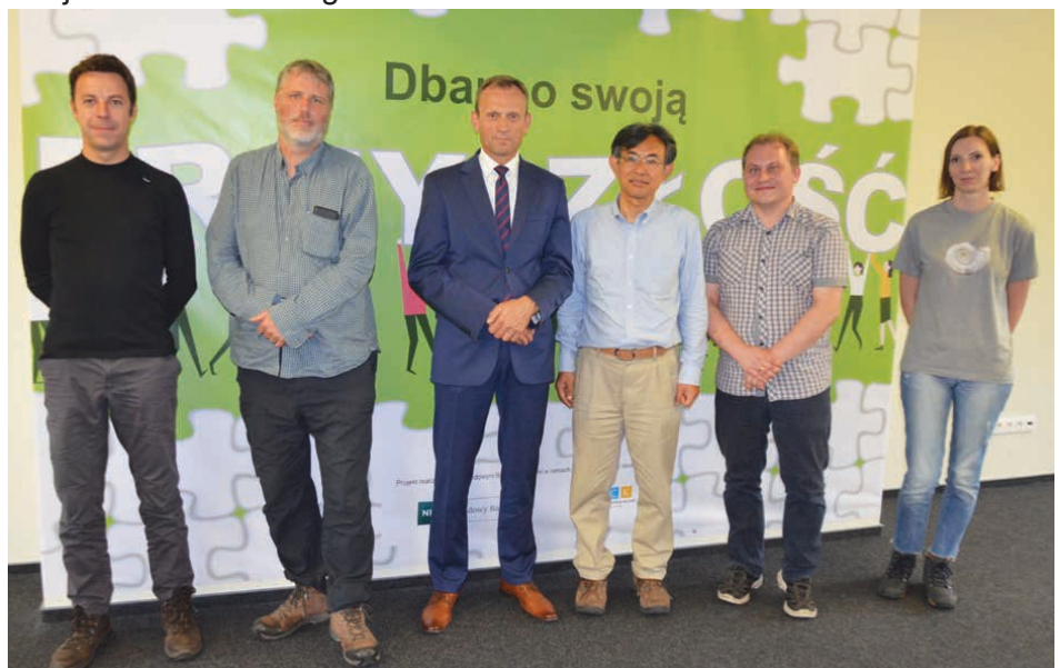
Gminę Piekoszów odwiedzili przedstawiciele UNESCO z Japonii i Anglii.