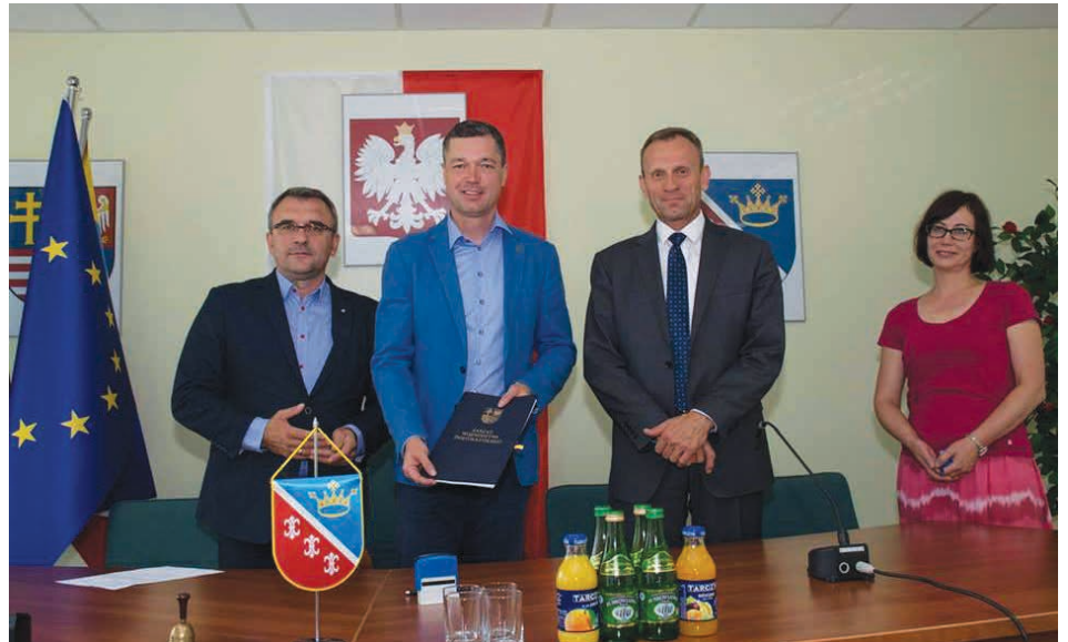
Wódcy gmin tuż po podpisaniu umowy.

środkom będziemy mogli pomóc mieszkańcom w zamontowaniu odnawialnych źródeł energii – podkreśla wódcy Piątek i przypomina, że według ekspertów proekologiczne przedsięwzięcie instalacji ogniw fotowoltaicznych, czy też solarów pozwala na znaczne obniżenie ra-