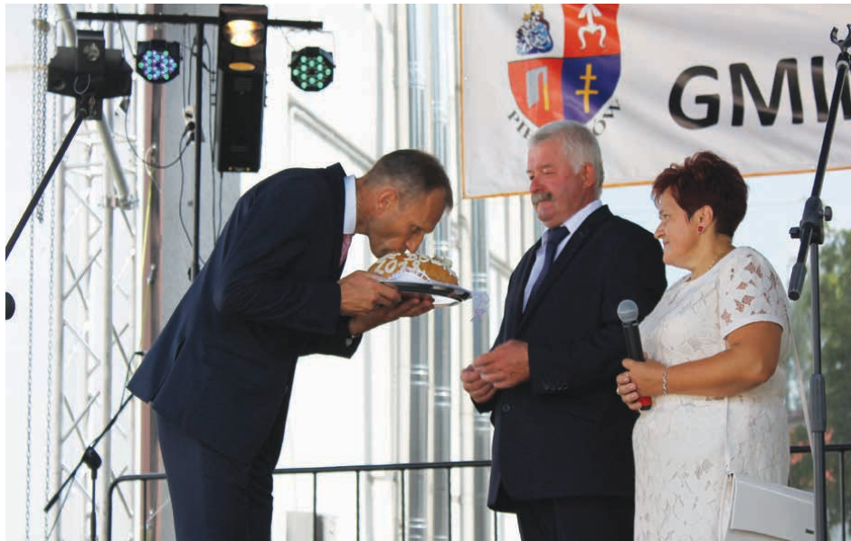
Starostowie podczas przekazywania chleba wójtowi gminy.