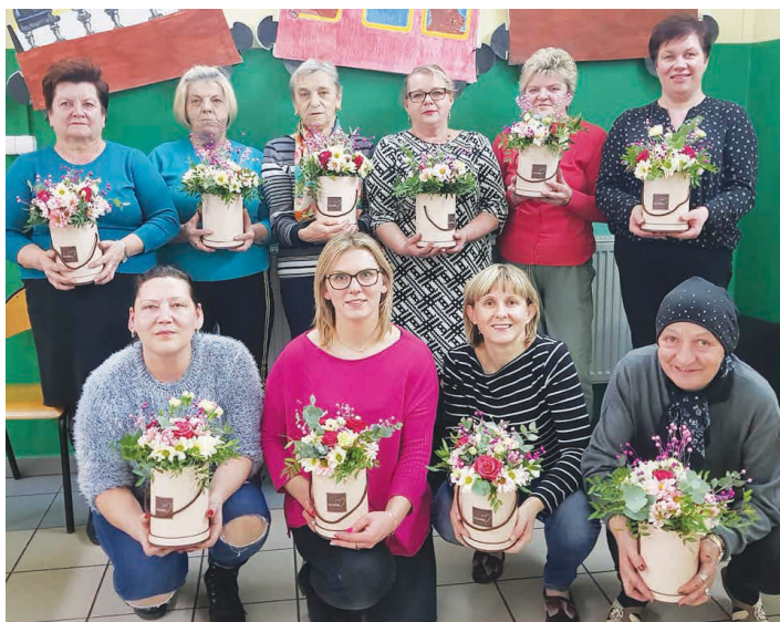
Kwieciste pudełka to świetny prezent nie tylko na Dzień Kobiet.