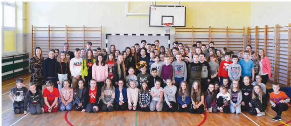
Uczniowie spotkali się z aktorami z kieleckiego teatru.

Tematem przewodnim działań XXVII Tygodnia Kultury Języka Szkoły Podstawowej w Brynicy było hasło „Zakochaj się od pierwszej strofy”.