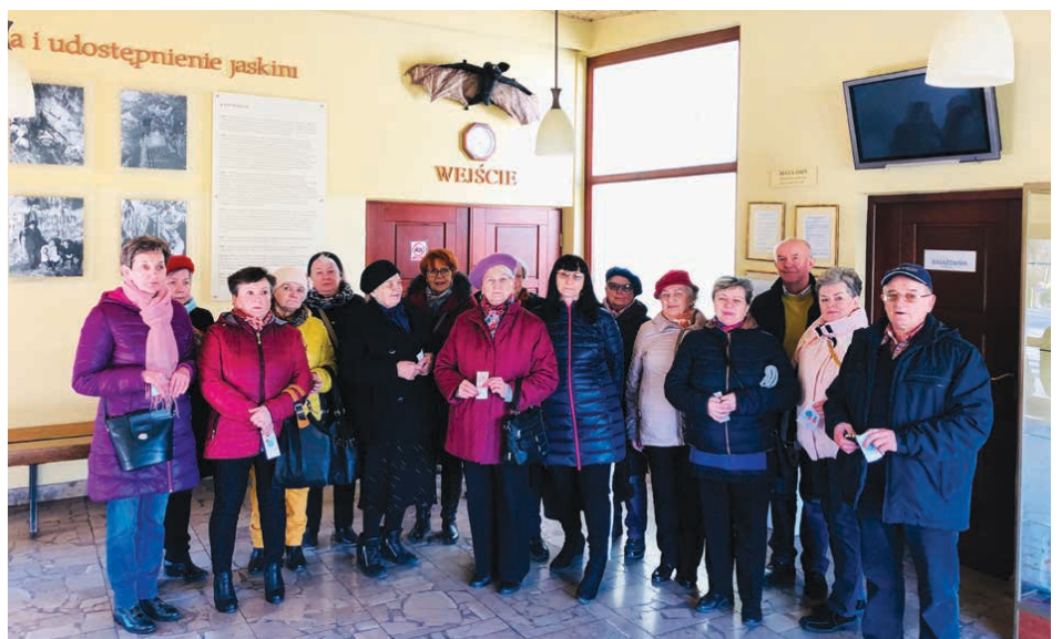
W środę 27 marca seniorzy zwiedzili Jaskinię Raj.