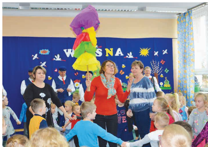
Przedszkolaki pożegnały zimę, a powitały wiosnę.