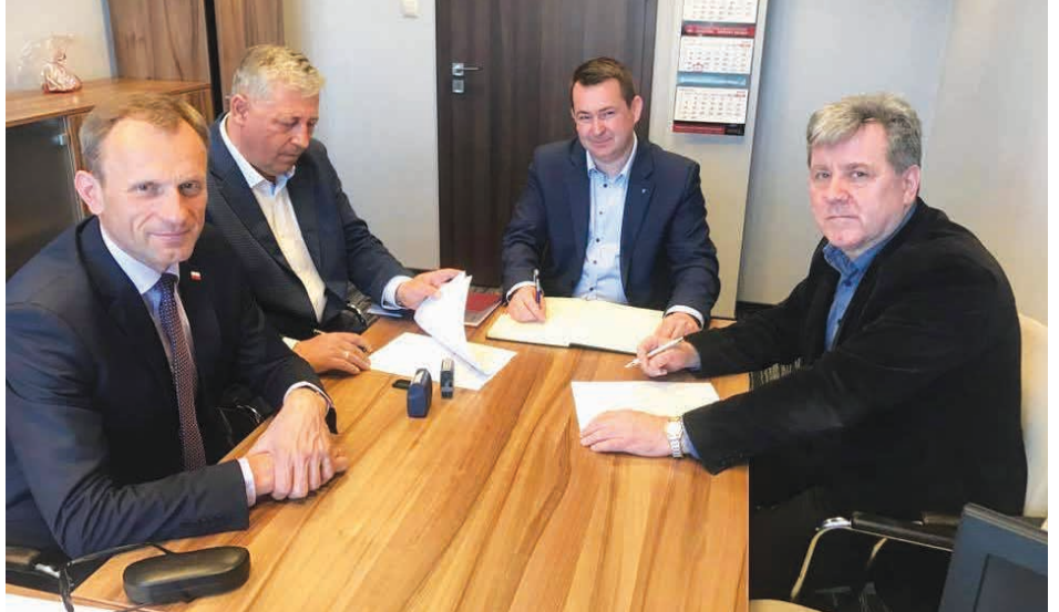
W czwartek 4 kwietnia w Starostwie Powiatowym w Kielcach podpisano umowę z firmą, która wykona remont drogi powiatowej.