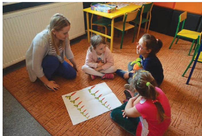
Tematem pierwszych zajęć była... marchewka.