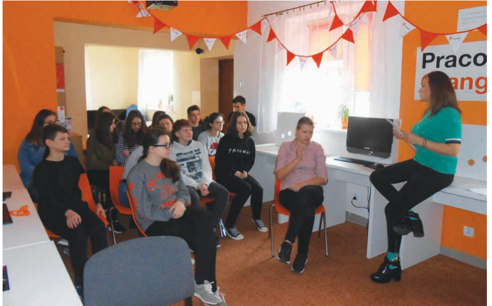
W każdej placówce rozmawiano o reagowaniu na hejt.

akcji dołączyli również muzycy z zespołu Afromental - Tomson i Baron, którzy zachęcają do udziału w kampanii na swoich kanałach.