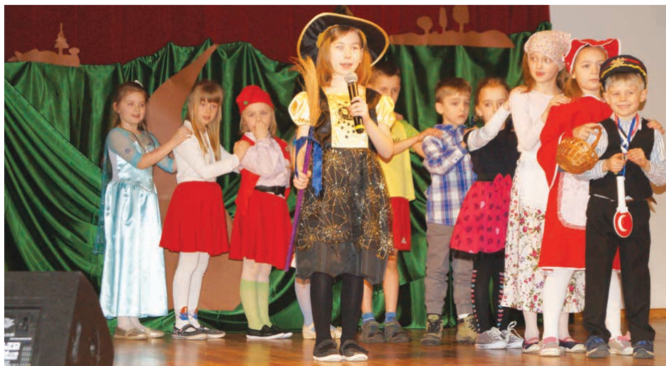
Na scenie dominowały wielobarwne stroje.

Po powitaniu rozpoczęto występ. Młodzi aktorzy pokazywali nie tylko swój aktorski talent oraz opamiętanie przedstawianego tekstu, ale zachwycali strojami, które świetnie komponowały się z wielobarwną i świetnie przygotowaną aranżacją