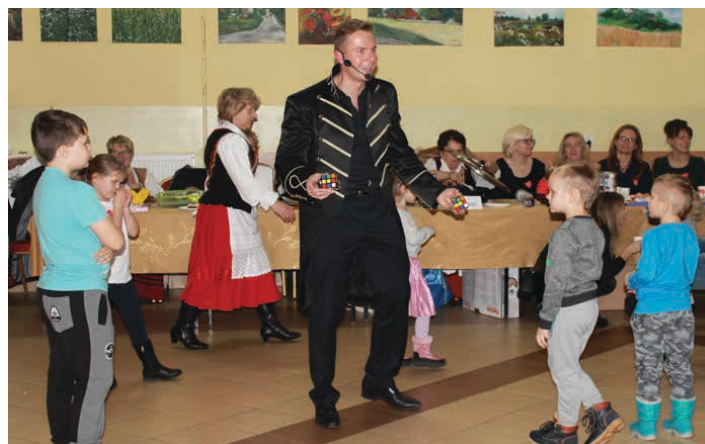
Pokaz iluzji wzbudził zainteresowanie nie tylko u najmłodszych.

odbywały się licytacje. I tak, do zdobycia były m.in. sportowe koszulki np. Zbigniewa Bońka czy Sławomira Szmala, kolacja z wójtem gminy Piekoszów, obfity koszyk słodczy czy też jubileuszowa filiżanka z Ćmielowa. Najwyższe ceny w licytacjach osiągnęła koszulka