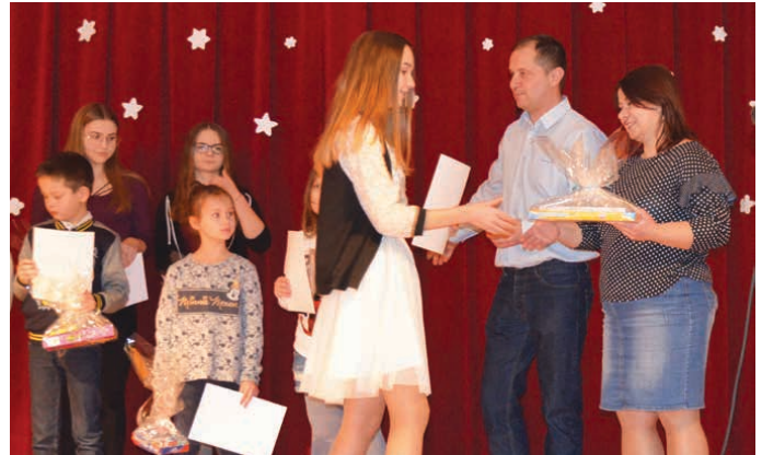
Wręczono także nagrody w konkursie „Malowane poezją”.