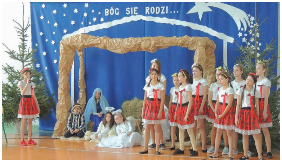
Tańca, śpiewu i wierszy na temat Bożego Narodzenia nie zabrakło w Zajączkowie.