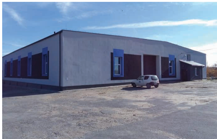
Zakład Usług Komunalnych w Piekoszowie.

I tak, do końca 2020 roku kompleksową termomodernizację przejdą szkoły w Brynicy, Rykoszynie, Szczukowskich Górkach, Micigoździe i Jaworzni. Planuje się