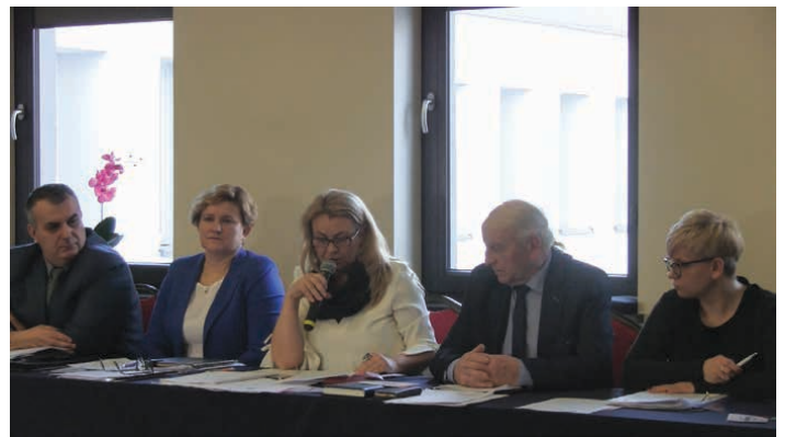
Podczas sesji podejmowano uchwały m.in. zmieniające budżet czy dotyczące sprzedaży lub nabycia nieruchomości.