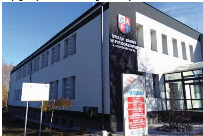
Budynek Urzędu Gminy w Piekoszowie.

Jest to pierwsza część gigantycznej inwestycji jaka została zaplanowana do zrealizowania na terenie gminy Piekoszów. Budynki te zostały ocieplone i gruntownie zmodernizowane, tak by były energooszczędne, tańsze w eksploatacji i bardziej przyjazne dla środowiska. – Najpierw rozpoczęliśmy inwestycje tam, gdzie budynki były w najgorszym stanie i wymagały natychmiastowych remontów. Dzięki termomodernizacji utrzymanie tych obiektów stało się zdecydowanie tańsze – mówi wójt gminy Piekoszów Zbigniew Piątek.