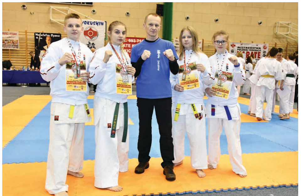
Medaliści Turnieju Kwalifikacyjnego w Turku.