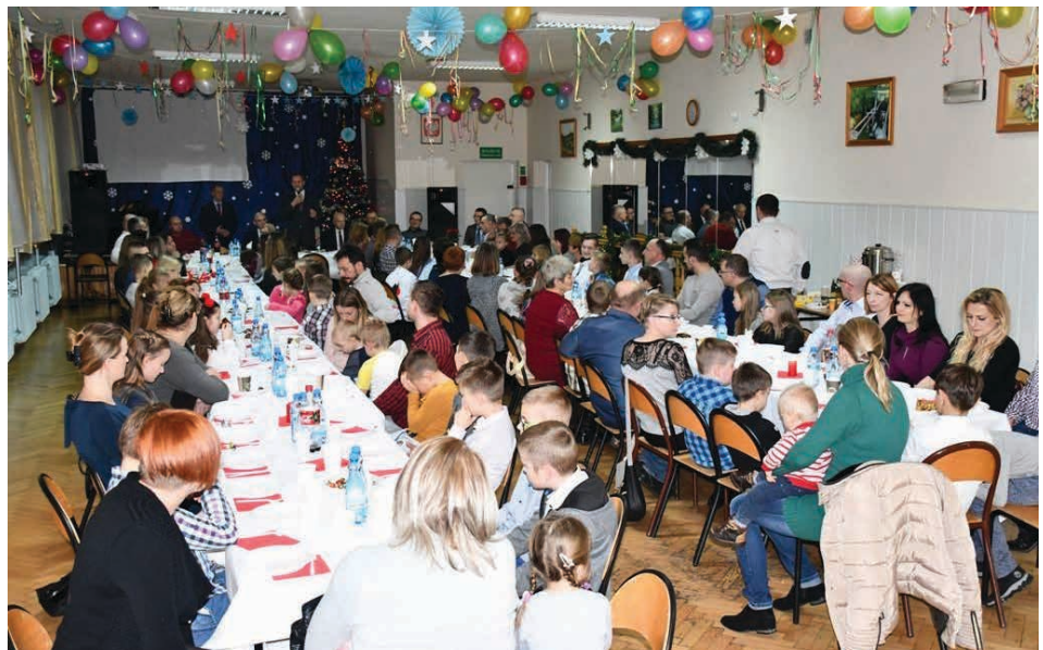
Z młodymi adeptami karate na wspólne kolędowanie przybyli ich najbliżsi.