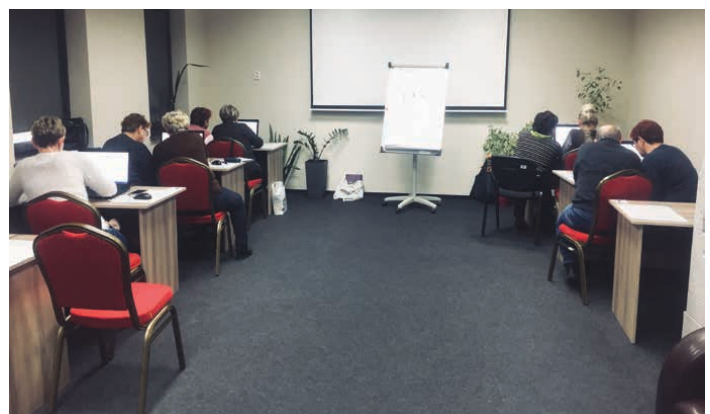
Seniorzy podczas nauki obsługi komputera.