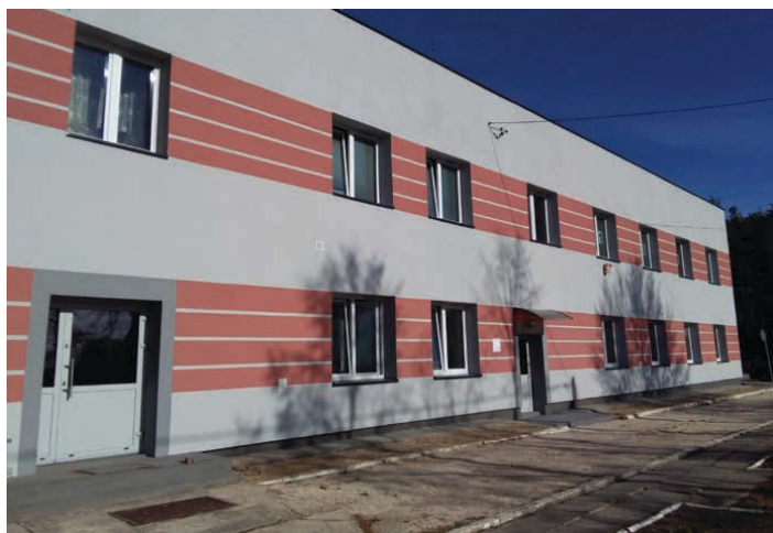
Szkoła Podstawowa w Łosieniu.

Ponad dwa miliony złotych kosztowała termomodernizacja placówek publicznych w gminie Piekoszów. Na realizację inwestycji władze gminy pozyskały aż 85 procent unijnego dofinansowania z Regionalnego Programu Operacyjnego Województwa Świętokrzyskiego na lata 2014-2020. Dzięki temu całkowite przeobrażenie przeszedł budynek Zakładu Usług Komunalnych, Urząd Gminy w Piekoszowie i Szkoła Podstawowa w Łosieniu.