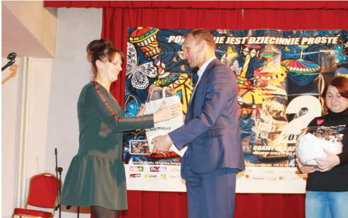
Losowanie loterii wywołało wiele emocji.

fantowej. Warto zaznaczyć, że sprzedały się wszystkie przygotowane losy. Co było do wygrania? Między innymi drobne gadzety takie jak parasole, kalendarze, kubki, ale również bony zakupowe lub kupony na pizzę. Najwięcej emocji wzbudziło losowanie głośnika