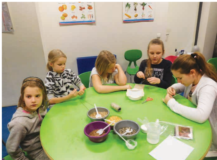
Dziewczęta podczas tworzenia karmników dla ptaków.

Uczestnicy wzięli udział w warsztatach, podczas których przygotowywali karmniki dla ptaków. Nie było