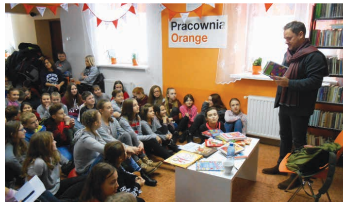
kcz/ Wizyta pisarza wprawiła obecnych w świetny nastrój.