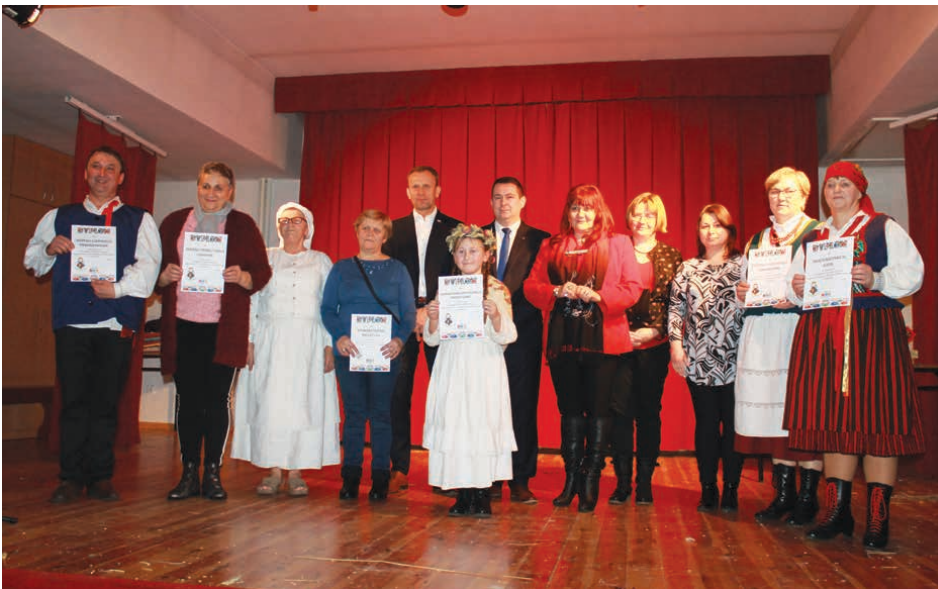
Reprezentanci wszystkich występujących grup.