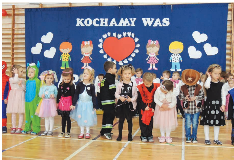
Dzieci przedstawiły program artystyczny.