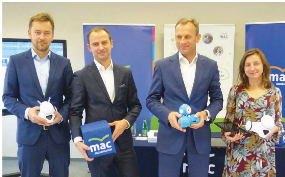
Podczas spotkania w siedzibie Grupy MAC prezentowane były m.in. roboty.

Wszyscy uczniowie biorący udział w projekcie otrzymają certyfikaty