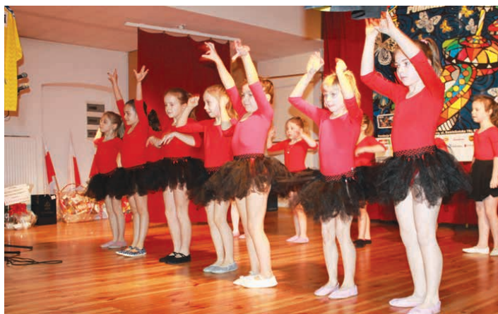
Podczas finału nie zabrakło tanecznego akcentu.