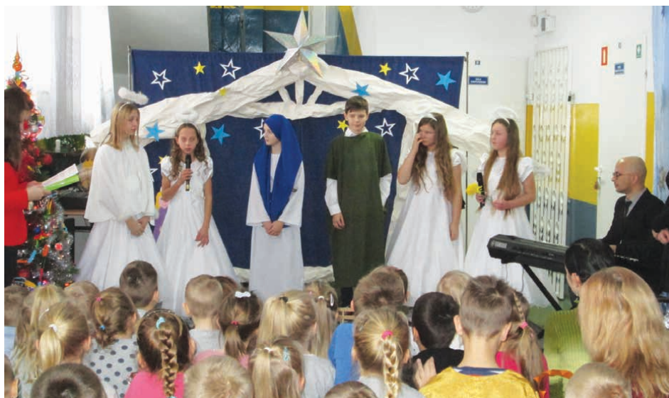
O narodzeniu Jezusa mówiono także w szkole w Micigózdzie.