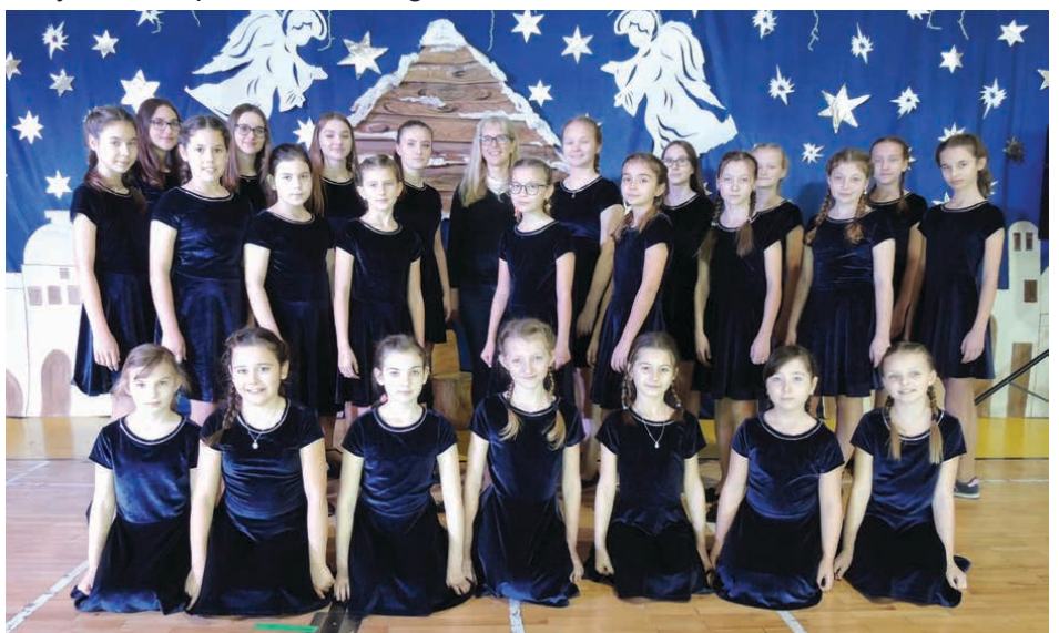
Chór BONUS ma na swoim koncercie wiele nagrodzonych występów.