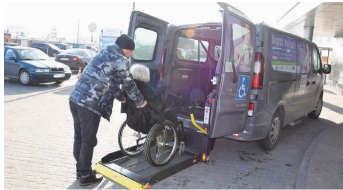
Świętokrzyskie Centrum Onkologii zapewnia pacjentkom z niepełnosprawnością bezpłatny dowóz na badania i z powrotem. Zamawianie busa: 609 99 00 33.