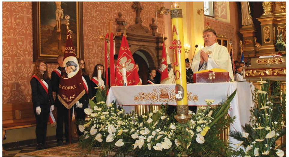
W kościele parafialnym w Piekoszowie sprawowana była uroczysta msza święta.

Jak co roku uroczystości rozpoczęła msza święta z udziałem poczty sztandarowych szkół, straży, z władzami gminy, radnymi, sołtysami, zaproszonymi gośćmi oraz mieszkańcami. Tuż po mszy przy akompaniamencie Orkiestry Dętej z Piekoszowa odbył się przemarsz ulicami Piekoszowa, który prowadził na Plac Niepodległości, gdzie kontynuowano uroczystość.