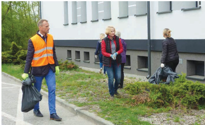
Wszyscy, którzy wzięli udział w akcji zasługują na wielkie brawa.

Wszystkim Mamom z okazji nadchodzącego Dnia Matki, życzę radości ze swoich dzieci, zadowolenia z każdej chwili, wytrwałości, cierpliwości i energii w opiece nad Pocięciami, a także niekończącego się uśmiechu. Natomiast wszystkim Dzieciom z racji ich święta 1 czerwca życzę powodzenia w nauce, sukcesów, przyjaciół i mnóstwa powodów do zabawy i radości.