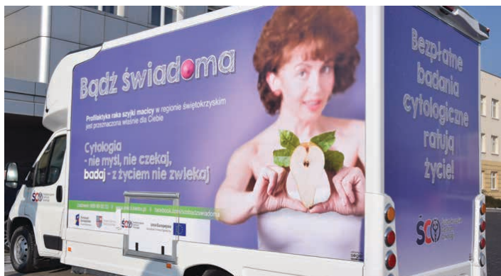
Cytobus – mobilny gabinet położnej Świętokrzyskiego Centrum Onkologii można zamówić bezpłatnie do każdej miejscowości. Tel.: 609 99 00 33.

Projekt „Być świadomą kobietą – wsparcie profilaktyki raka szyjki macicy poprzez działania zachęcające kobiety z Kieleckiego Obszaru Funkcjonalnego do badań profilaktycznych” jest dofinansowany z Europejskiego Funduszu Społecznego w ramach Regionalnego Programu Operacyjnego Województwa Świętokrzyskiego na lata 2014 – 2020.