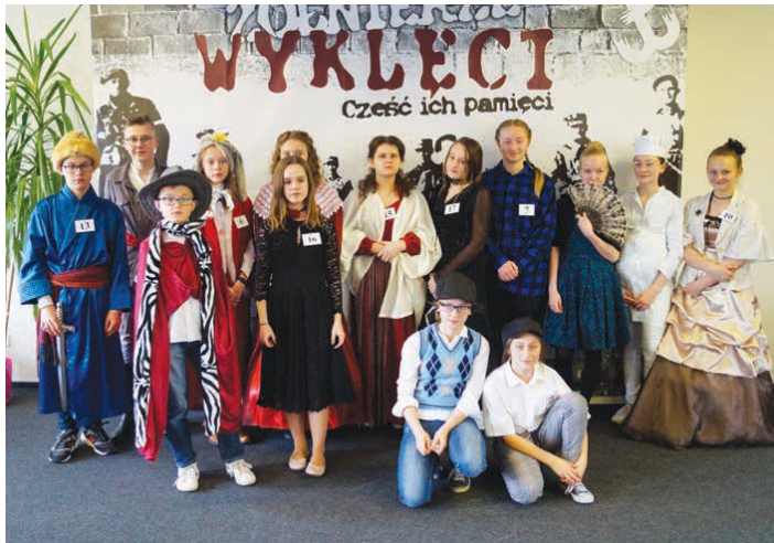
Uczestnicy przebrani w stroje prezentowanych bohaterów.