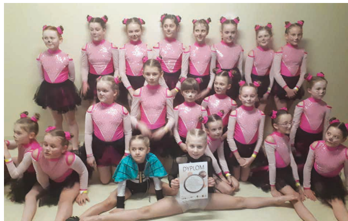
Zespół Efekt odniósł już niejedną taneczny sukces.

że uda nam się zdobyć czwarte miejsce w kraju – mówią zgodnie tancerze Efektu. /A.Olech/