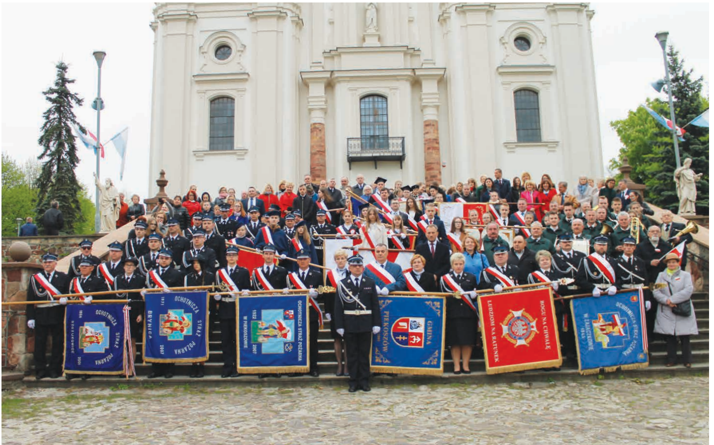
Poczty sztandarowe, przedstawiciele władz i rady gminy Piekoszów, zaproszeni goście i mieszkańcy biorący udział w uroczystości.

O sile jaką dawała Polakom uchwalona Konstytucja mówiła również Przewodnicząca Rady Gminy