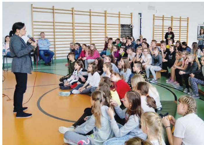
Uczniowie z uwagą słuchali wykładu, który dotyczył praktycznie codziennego użytkowania np. Facebook'a.