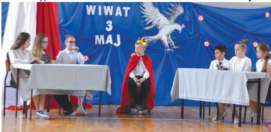
Uczniowie z zaangażowaniem wcielili się w swoje role.