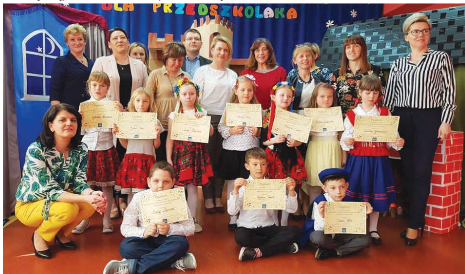
Przepiękne stroje były wizytówką występujących przedszkolaków.