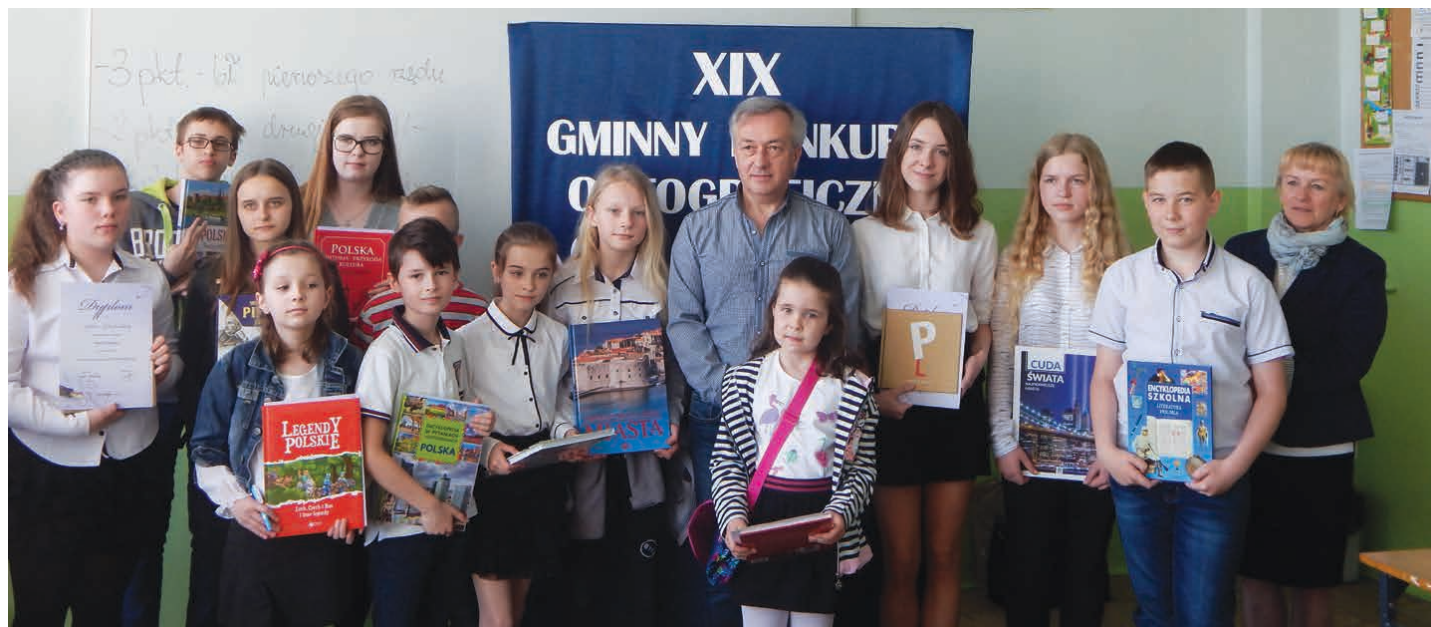
Laureaci konkursu ortograficznego.

/SP Piekoszów/, /SP Rykoszyn/, /SP Łosień/