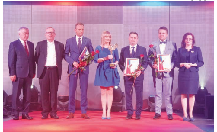
Wójt gminy Piekoszów tuż po odebraniu nominacji.