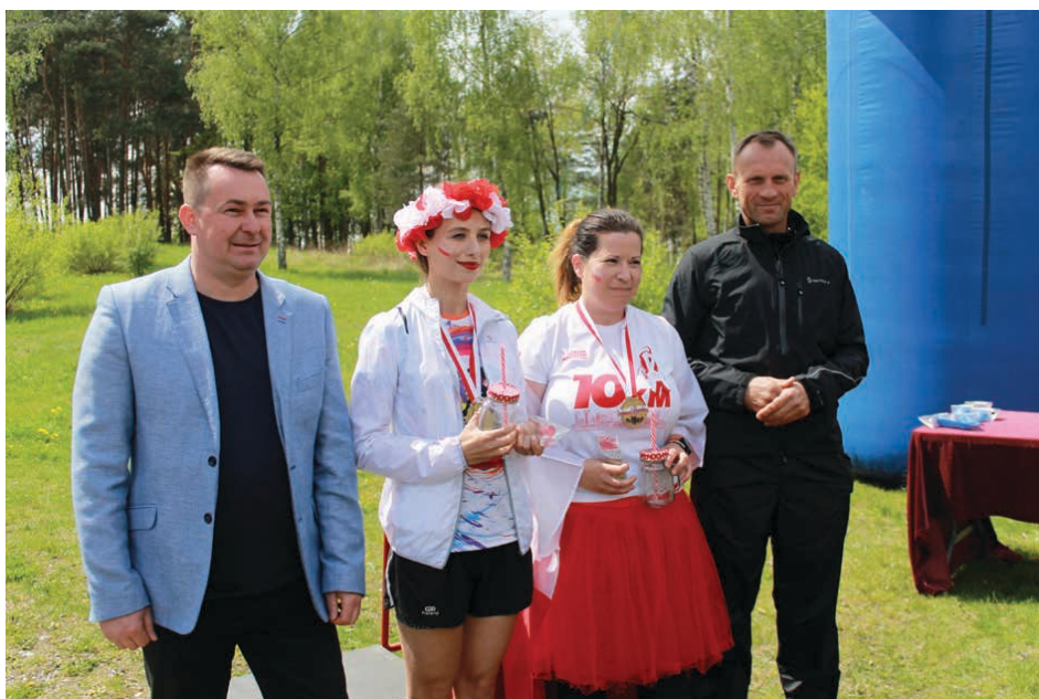
Biegaczki posiadały ogromne pokłady energii i... kolorowe stroje.