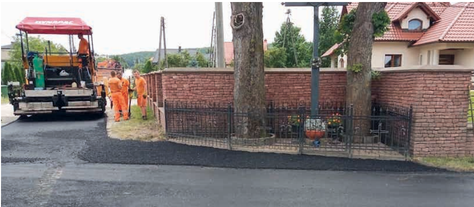
Nowy asfalt na skrzyżowaniu w Janowie.