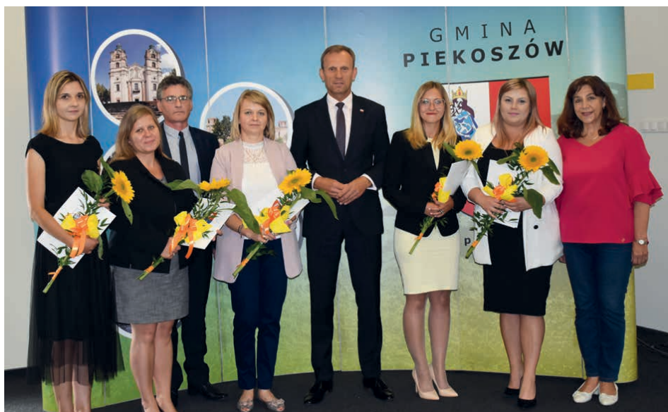
Pięciu nauczycieli z gminy Piekoszów otrzymało awans zawodowy nauczyciela mianowanego.