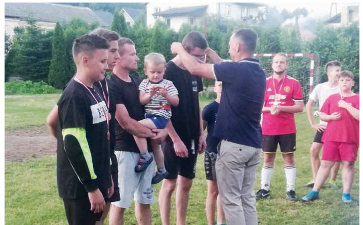
Sołtys Janowa wręczał medale i puchar.