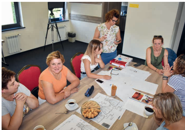
Podczas spotkania uczestniczki przedstawiały swoje pomysły.

„EkoEtno” to innowacyjny projekt realizowany przez Bibliotekę Centrum Kultury w Piekoszowie, którego celem jest zainteresowanie mieszkańców gminy Piekoszów tradycją regionu i kulturą ludową. Projekt zakłada stworzenie nowych ubrań z elementami ludowymi.