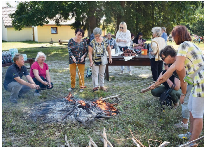
O pyszne kiełbaski zadbał Klub Seniora z Piekoszowa.

plakaty namawiające do dbania o naszą planetę i inne plastyczne arcydzieła; przeprowadzono eksperymenty m.in. kolorowe wulkany, organizowano liczne zawody sportowe, bo jak wiadomo ruch to zdrowie. Uczestnicy mogli również śpiewać i tańczyć, a także „ruszyć głową” podczas rozwiązywania zagadek czy quizów.