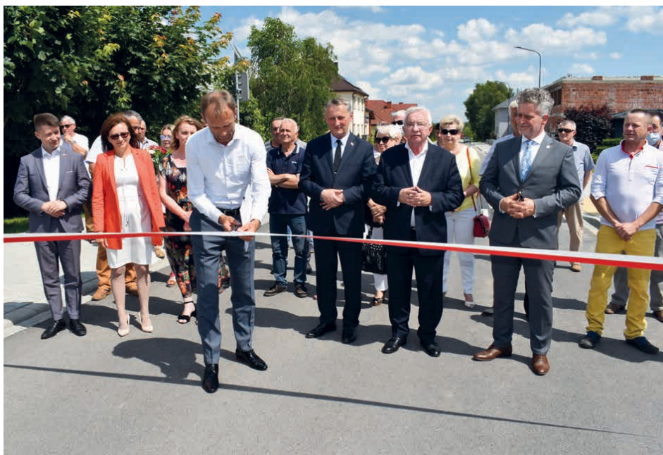
Uroczyste otwarcie ulic Klonowej i Kasztanowej w Piekoszowie.