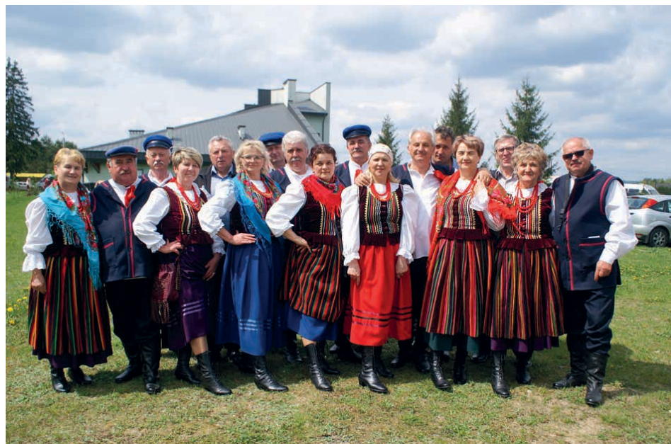
Barwne stroje, ludowa muzyka i taniec to wizytówki zespołu „Wierna Rzeka”.