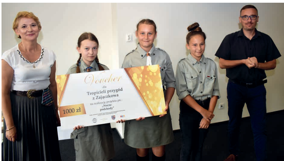
Tropiciele przygód z Zajączkowa to jedna z grup, która otrzymała dofinansowanie.

Projekt „Przestrzeń dla młodych - II edycja” dofinansowano ze środków Województwa Świętokrzyskiego w ramach programu „Świętokrzyskie dla młodych”