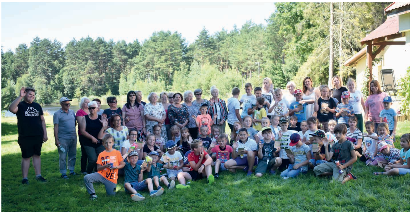
Akcja wakacyjna BCK dobiegła końca.