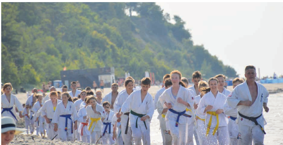
Karatecy trenowali w pięknych zakątkach przyrody w Jastrzębiej Górze.

A tych w szeregach Klubu Karate Morawica i Piekoszów nie brakuje. Swoje umiejętności doskonalią podczas ciężkich treningów całorocznych. Czas wakacji to dla nich sportowy wypoczynek. – Każdego roku organizujemy wyjazdy sportowe nie tylko letnie, ale też zimowe. Nasze obozy to nie tylko