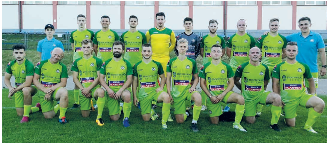
Drużyna Astry Piekoszów.

Początek sierpnia to start rozgrywek kieleckiej A-klasy, w której gminę Piekoszów reprezentują dwa zespoły: Astra Piekoszów i Sokół-Nordkalk Górnik Rykoszyn.