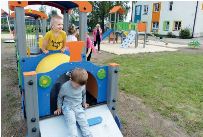
Plac zabaw sprawia radość jego małym użytkownikom.

Dzięki rozbudowie na parterze budynku powstały nowe pomieszczenia, co pozwoliło na stworzenie dwóch kolejnych oddziałów dla 26 maluchów. Powstała też kuchnia z jadalnią, pomieszczenie gospodarcze i sala gimnastyczna. Kolejne 72 tysiące 600 złotych dofinansowania pozyskano na bieżące funkcjonowanie placówki.