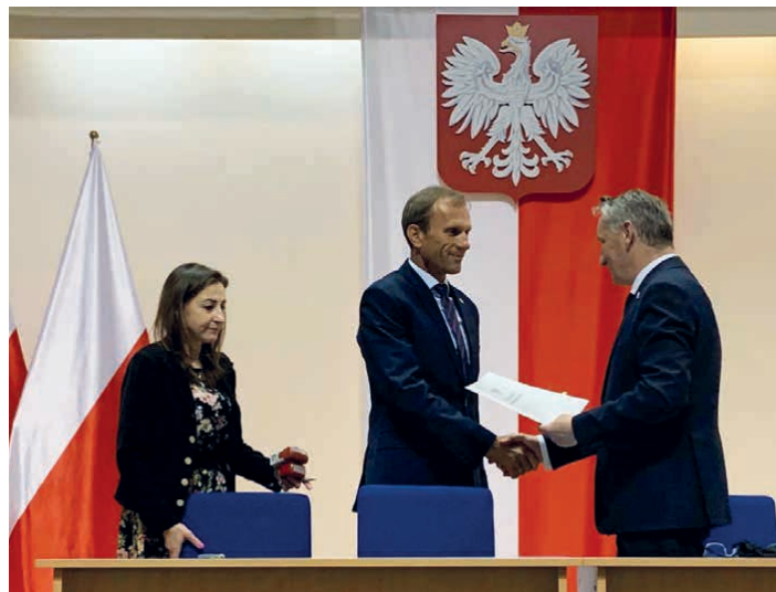
Gratulacje na ręce Wójta gminy Piekoszów złożył Wojewoda Świętokrzyski Zbigniew Koniusz.